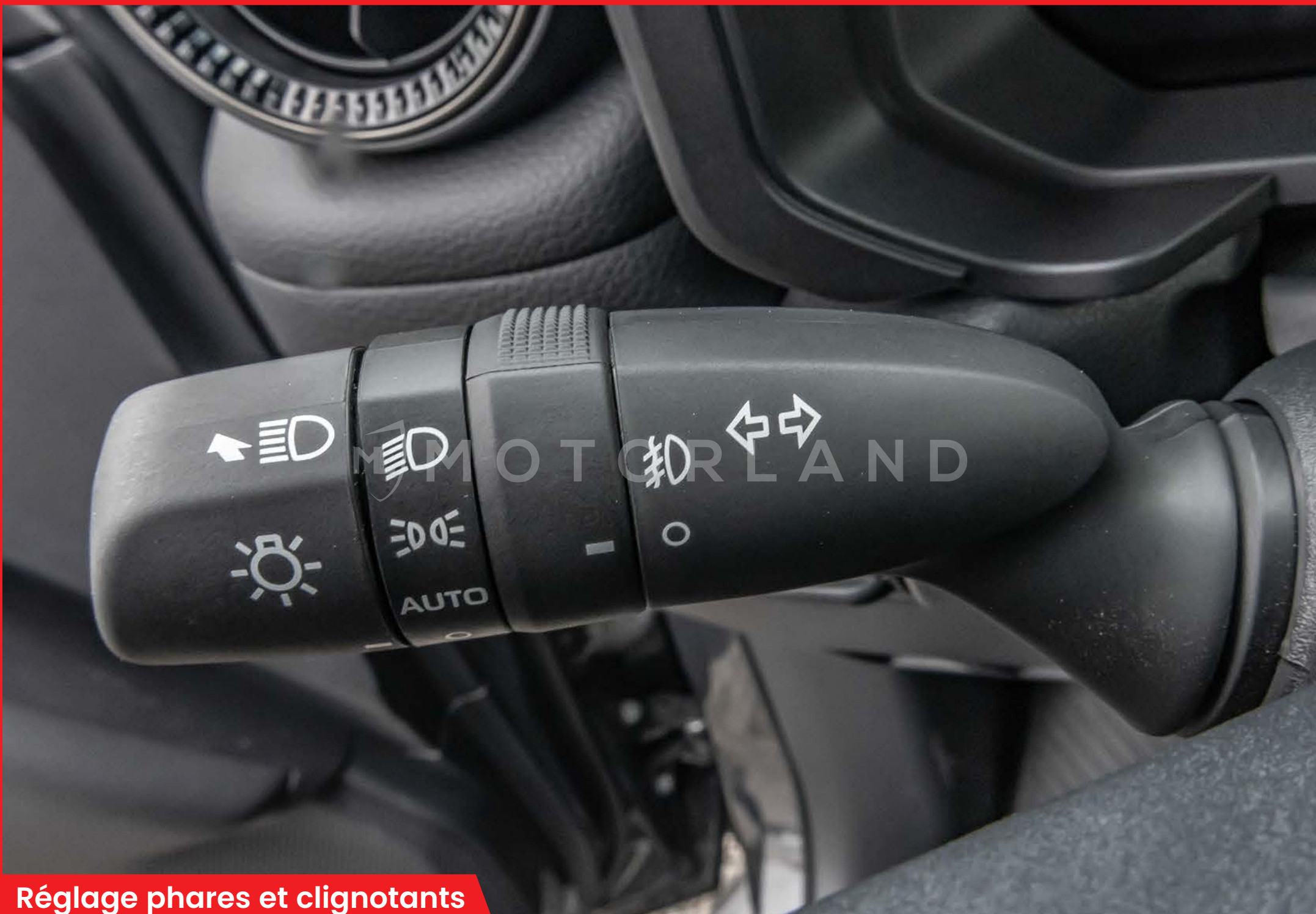
Réglage phares et clignotants