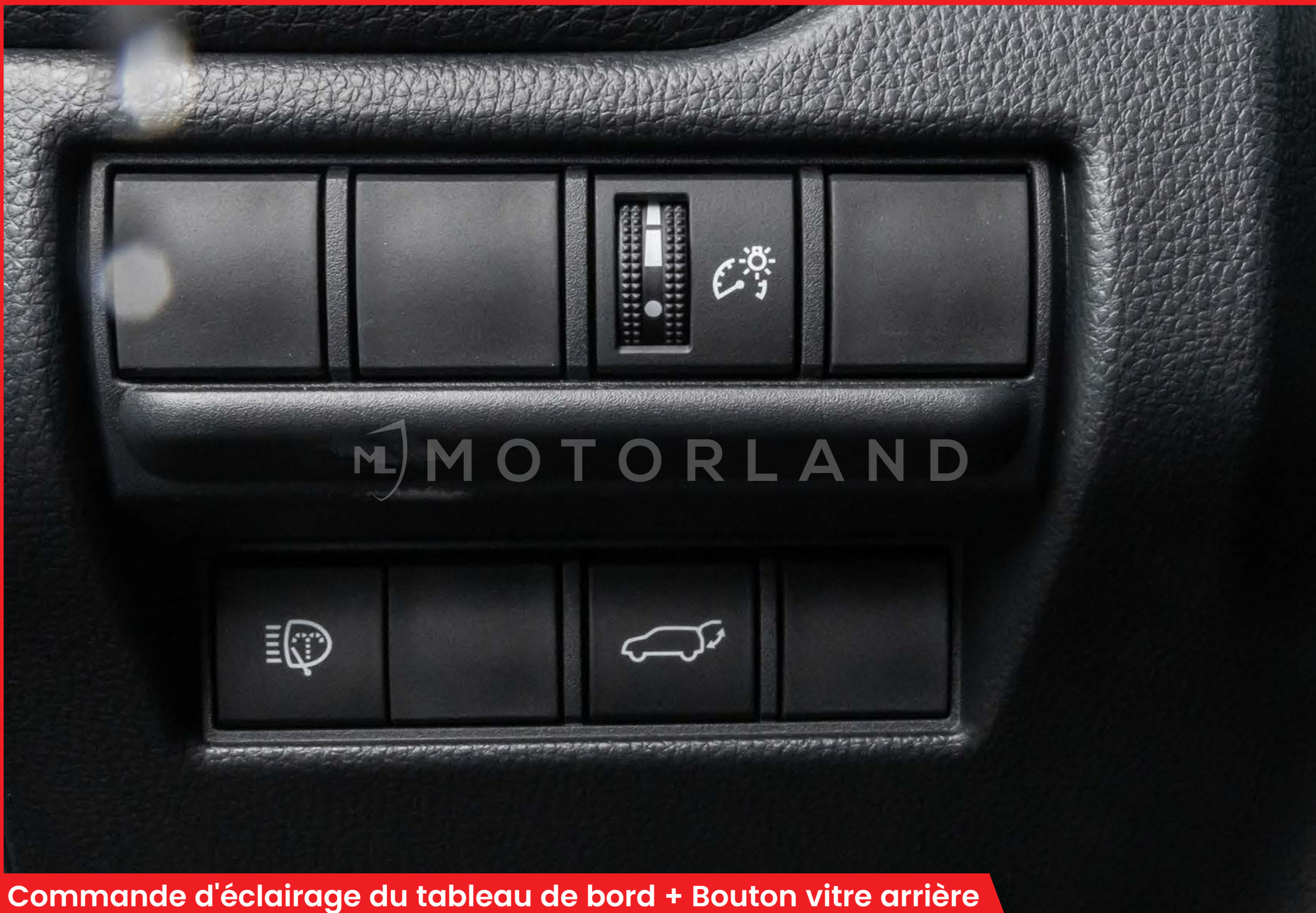
Commande d'éclairage du tableau de bord + Bouton vitre arrière