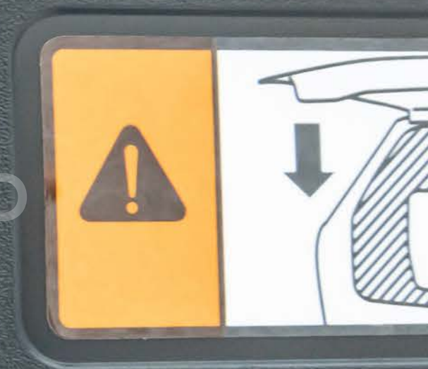
Bouton coffre électrique