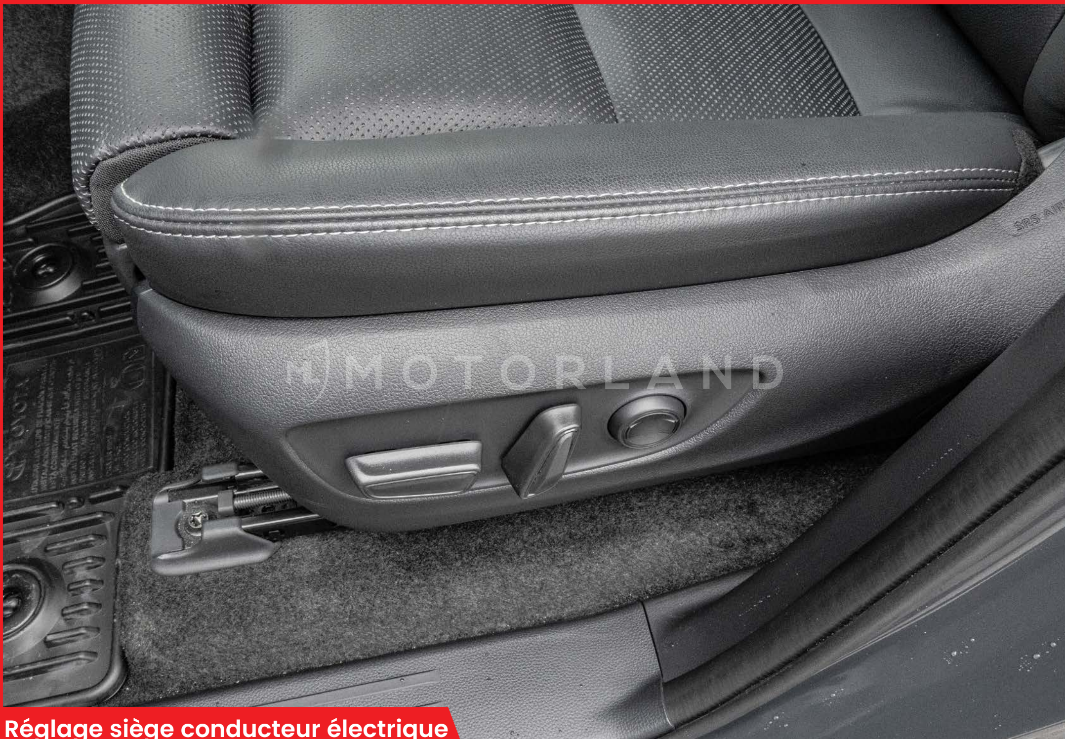
Réglage siège conducteur électrique