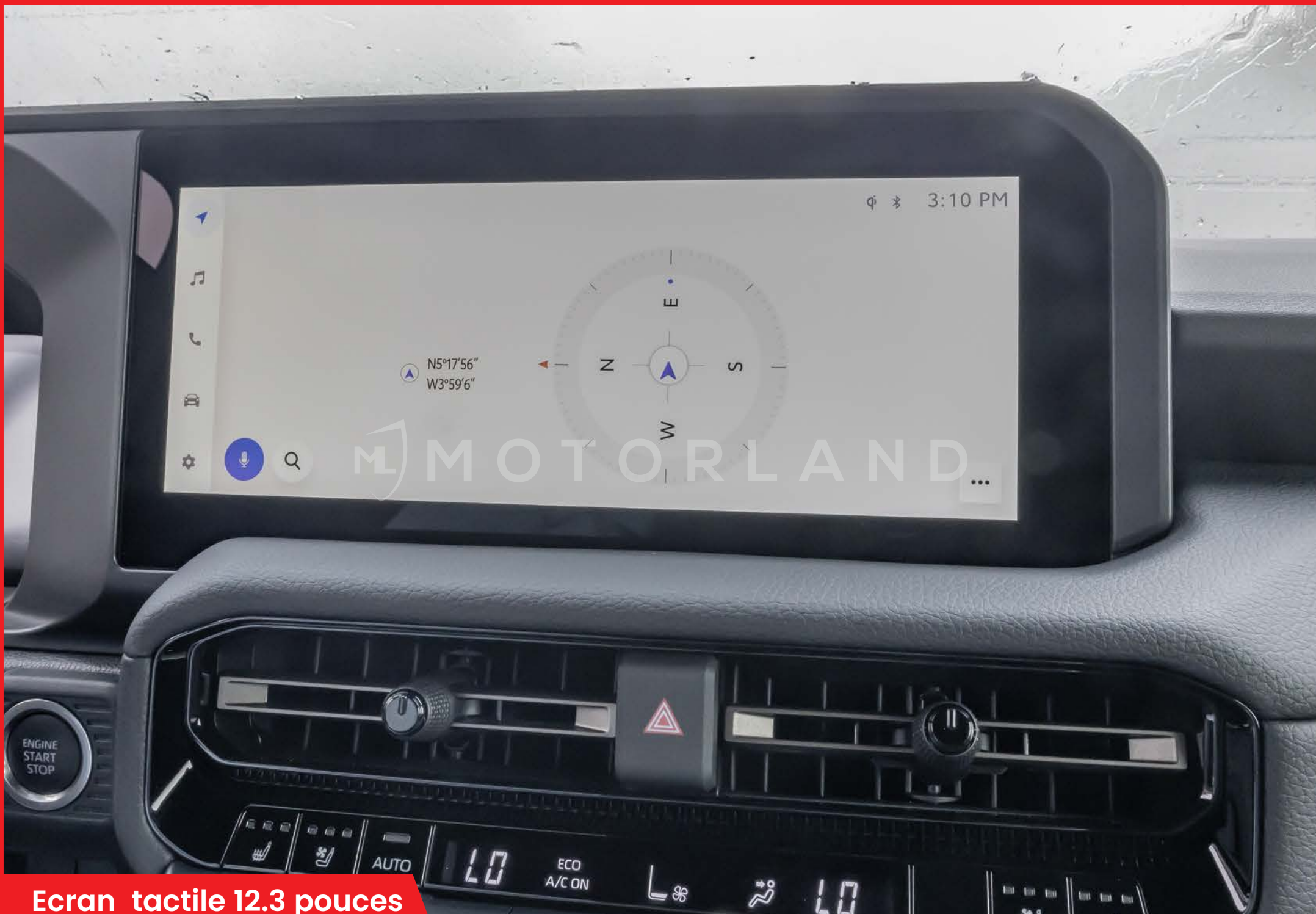
Ecran tactile 12.3 pouces