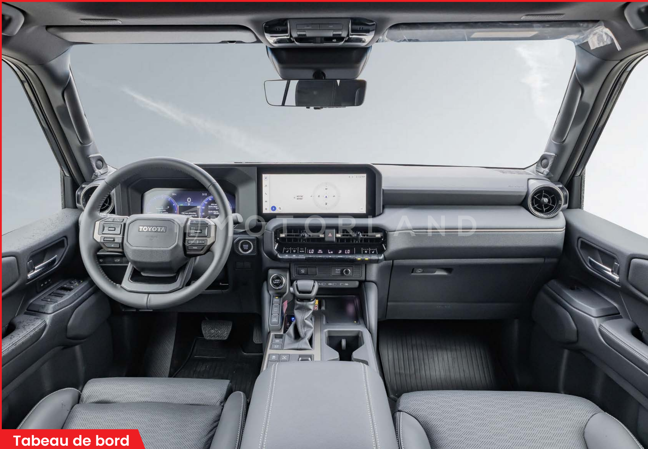
Tableau de bord