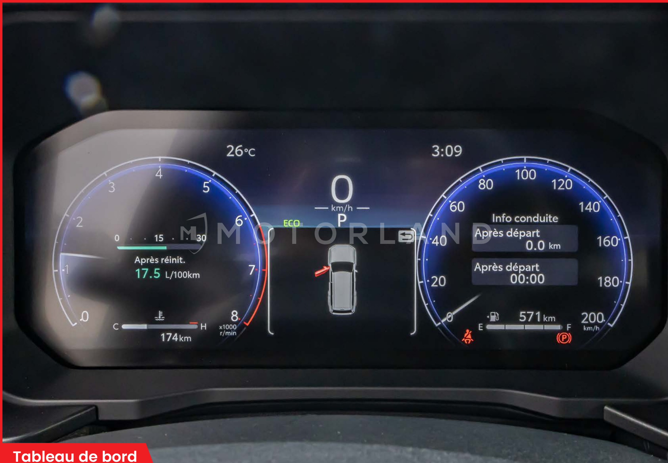
Tableau de bord