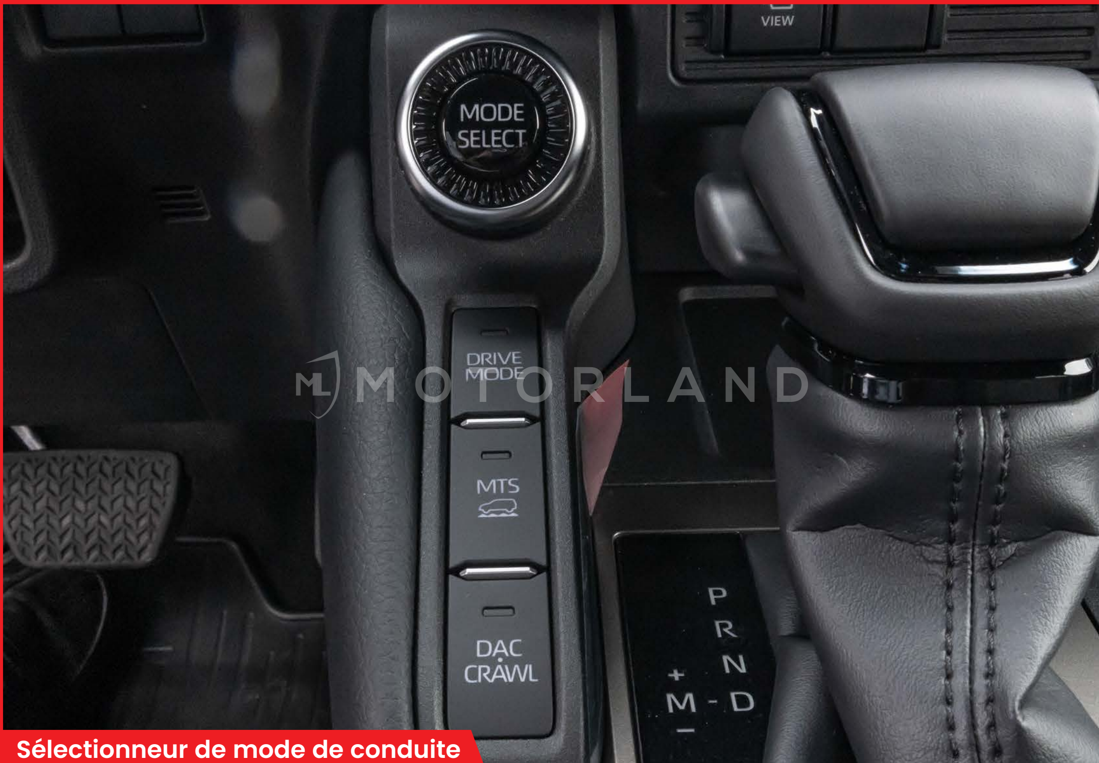
Sélecteur de mode de conduite