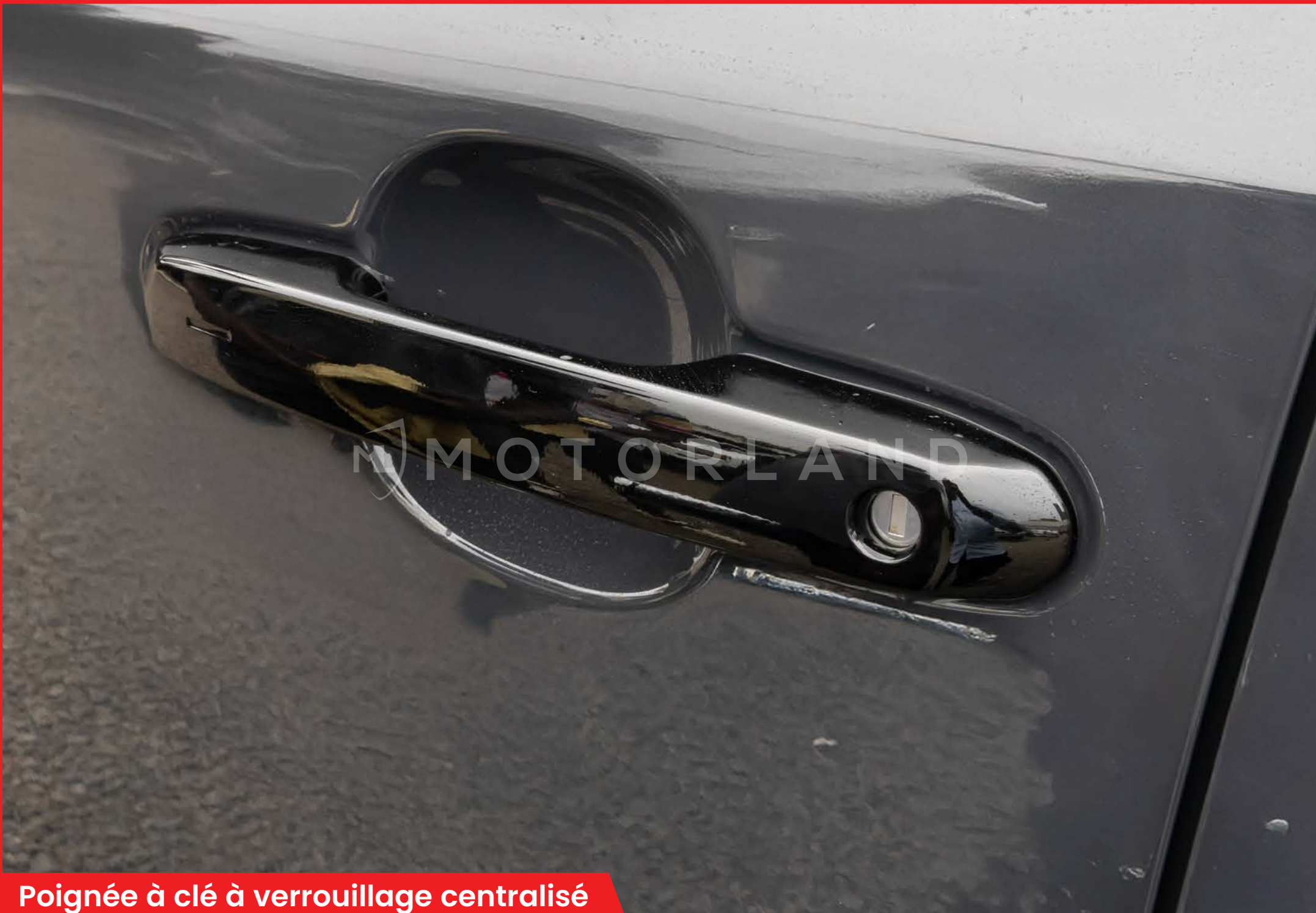
Poignée à clé à verrouillage centralisé