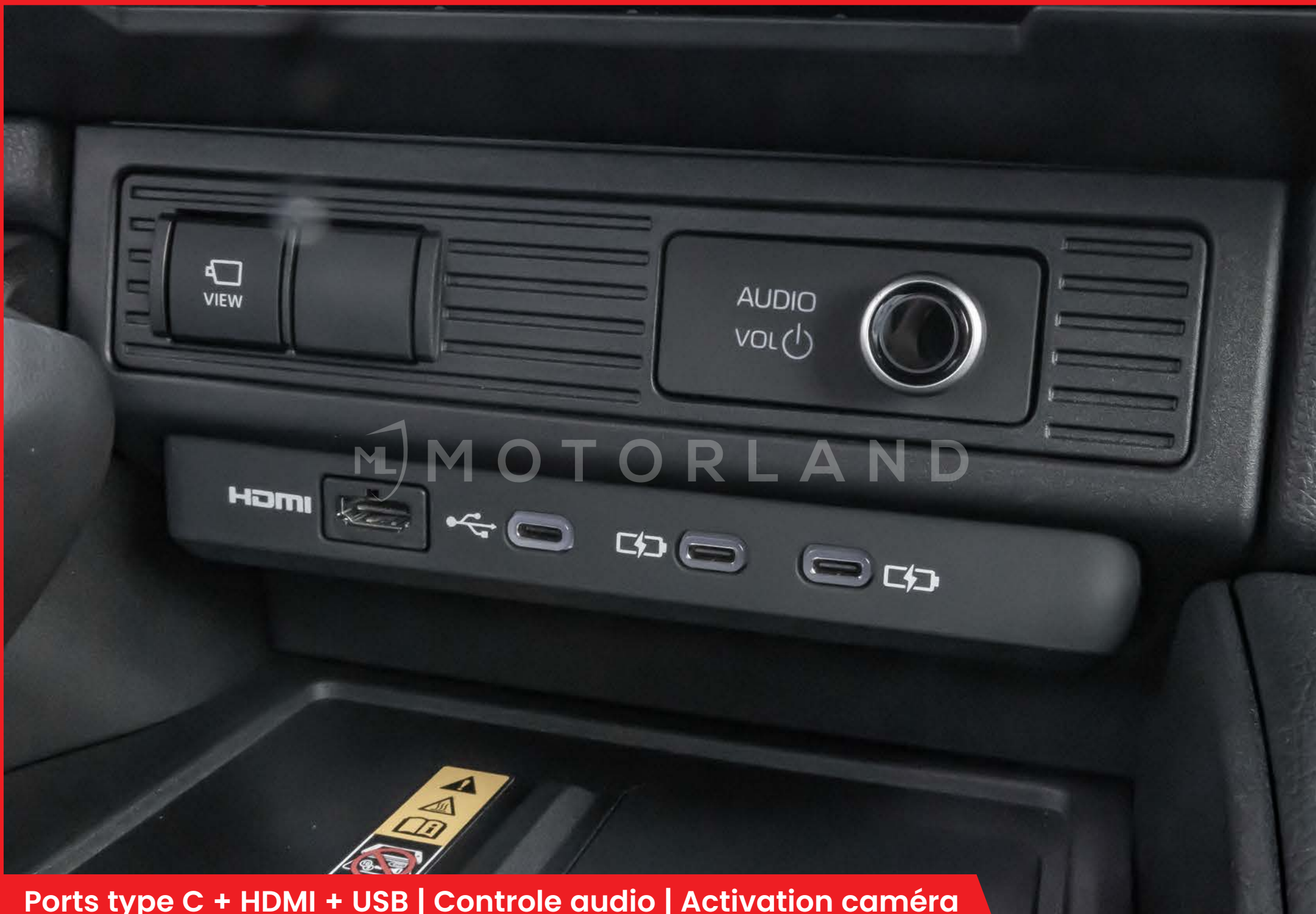
Ports type C + HDMI + USB | Controle audio | Activation caméra