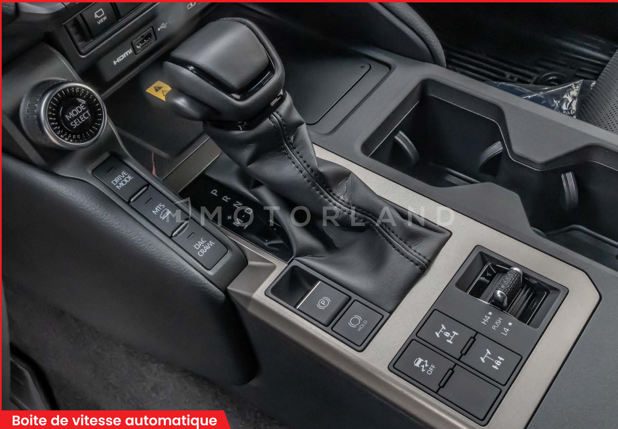
Boite de vitesse automatique