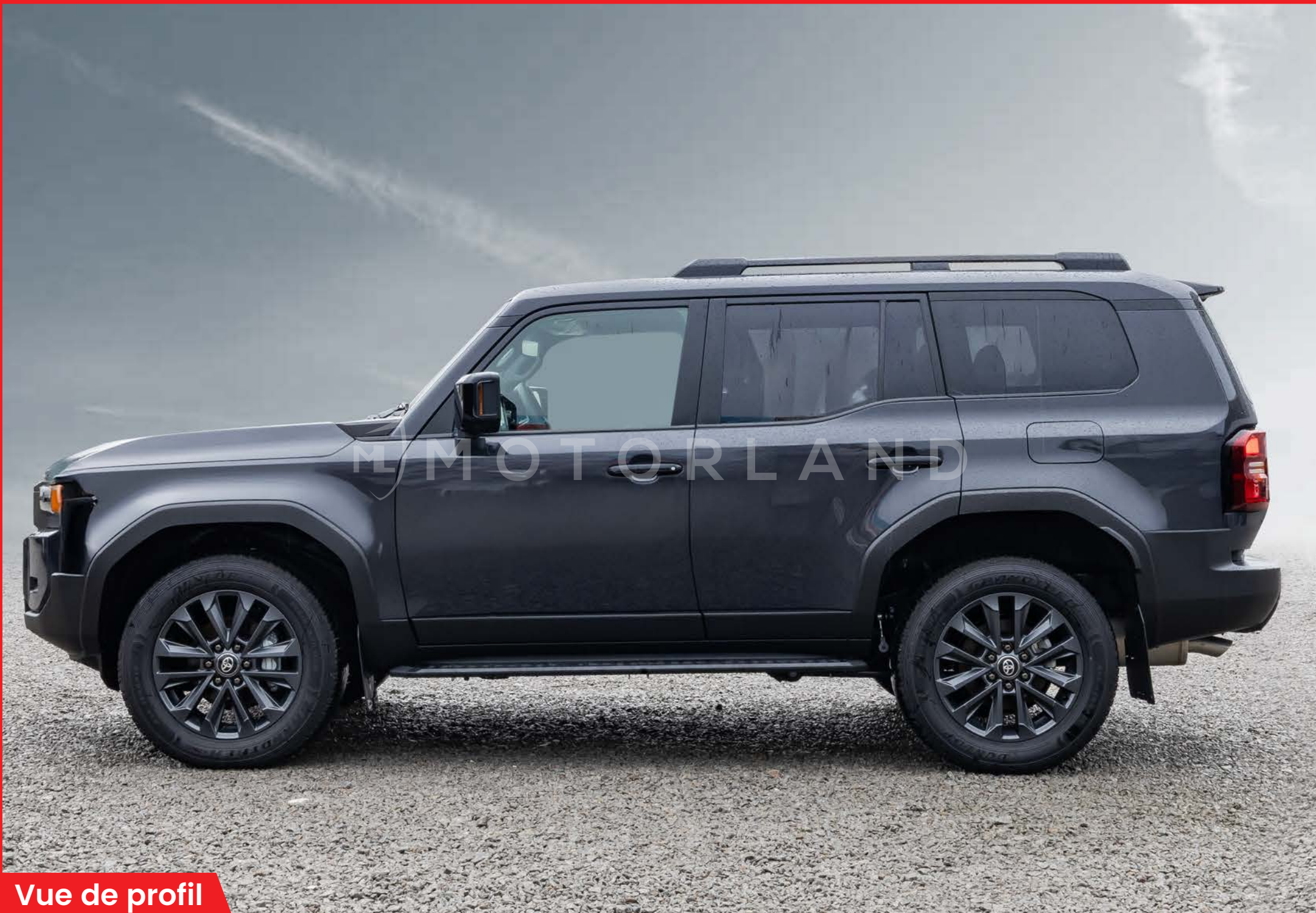
Vue de profil