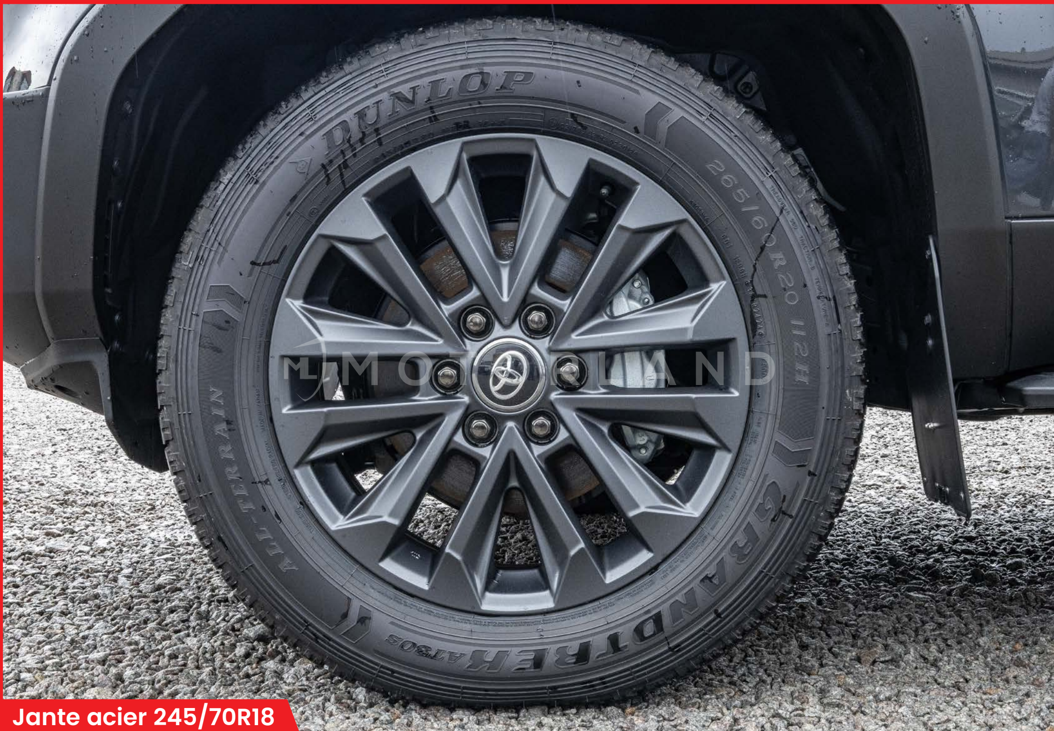
Jante acier 245/70R18