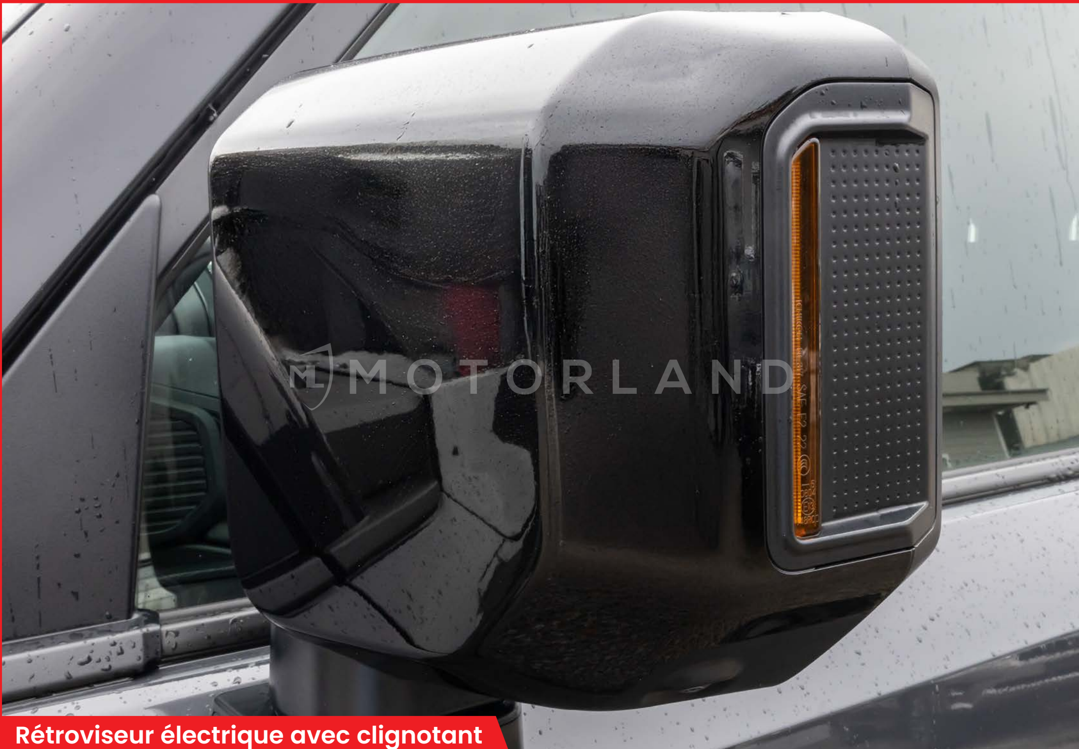
Rétroviseur électrique avec clignotant