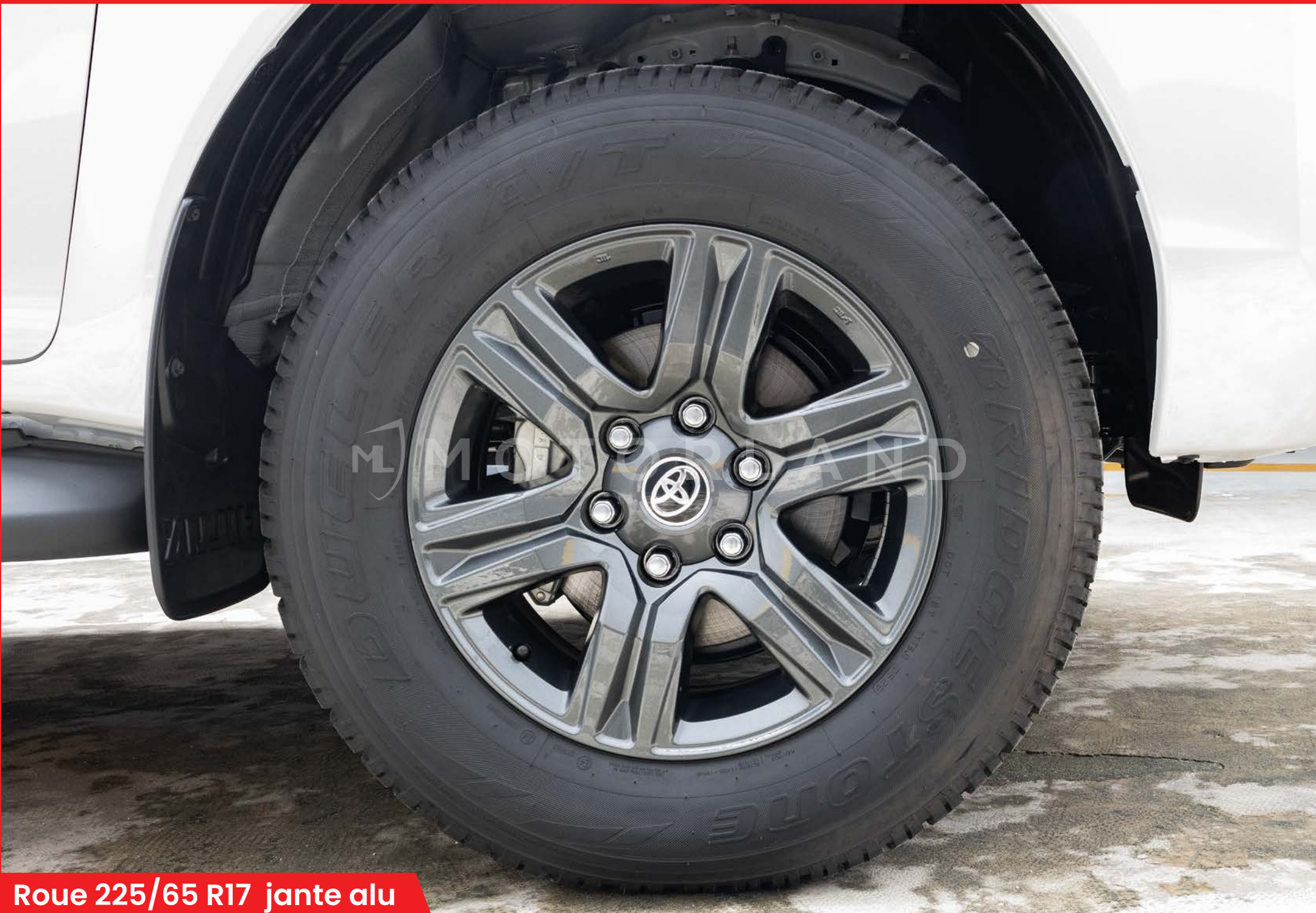
Roue 225/65 R17 jante alu