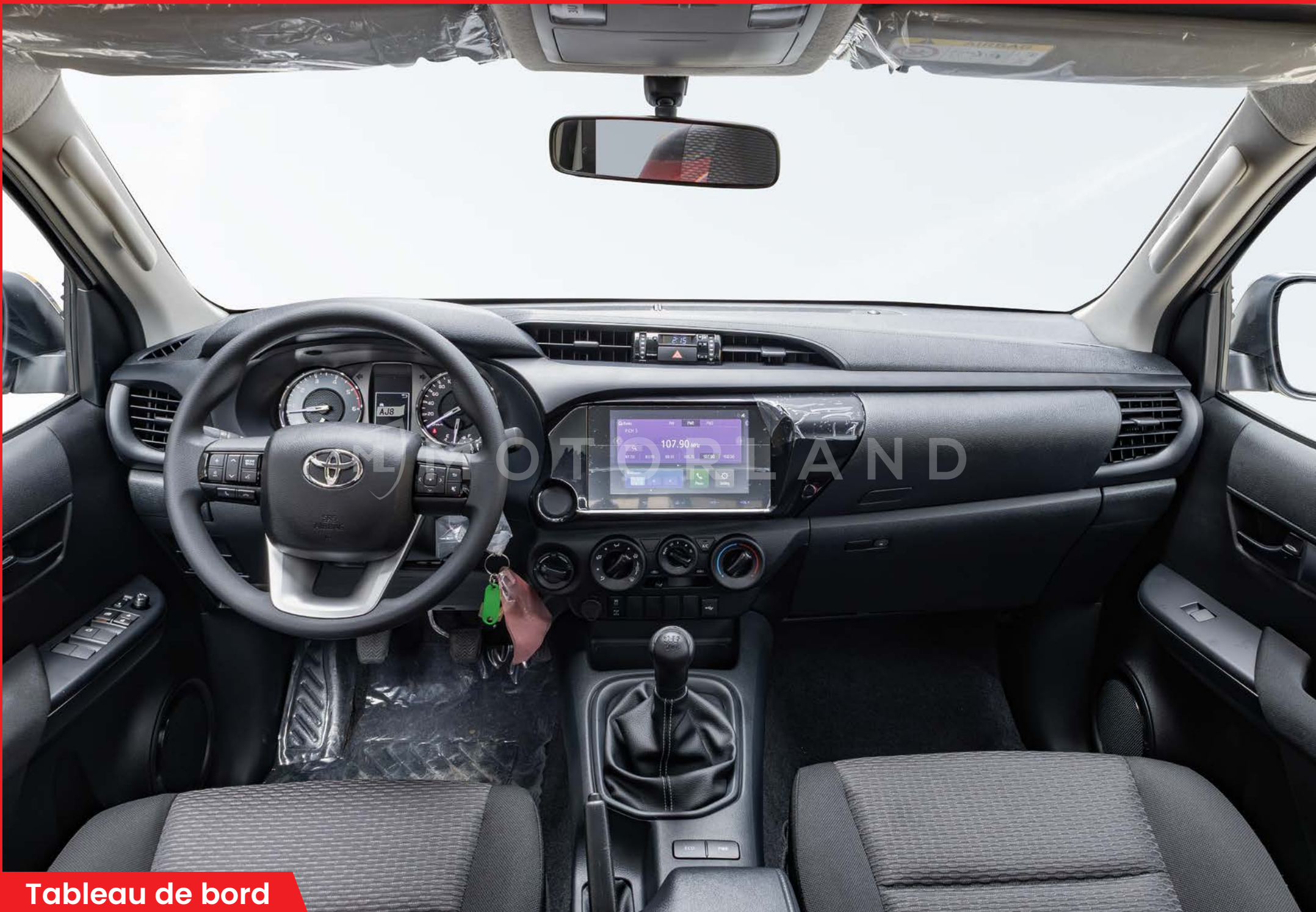
Tableau de bord