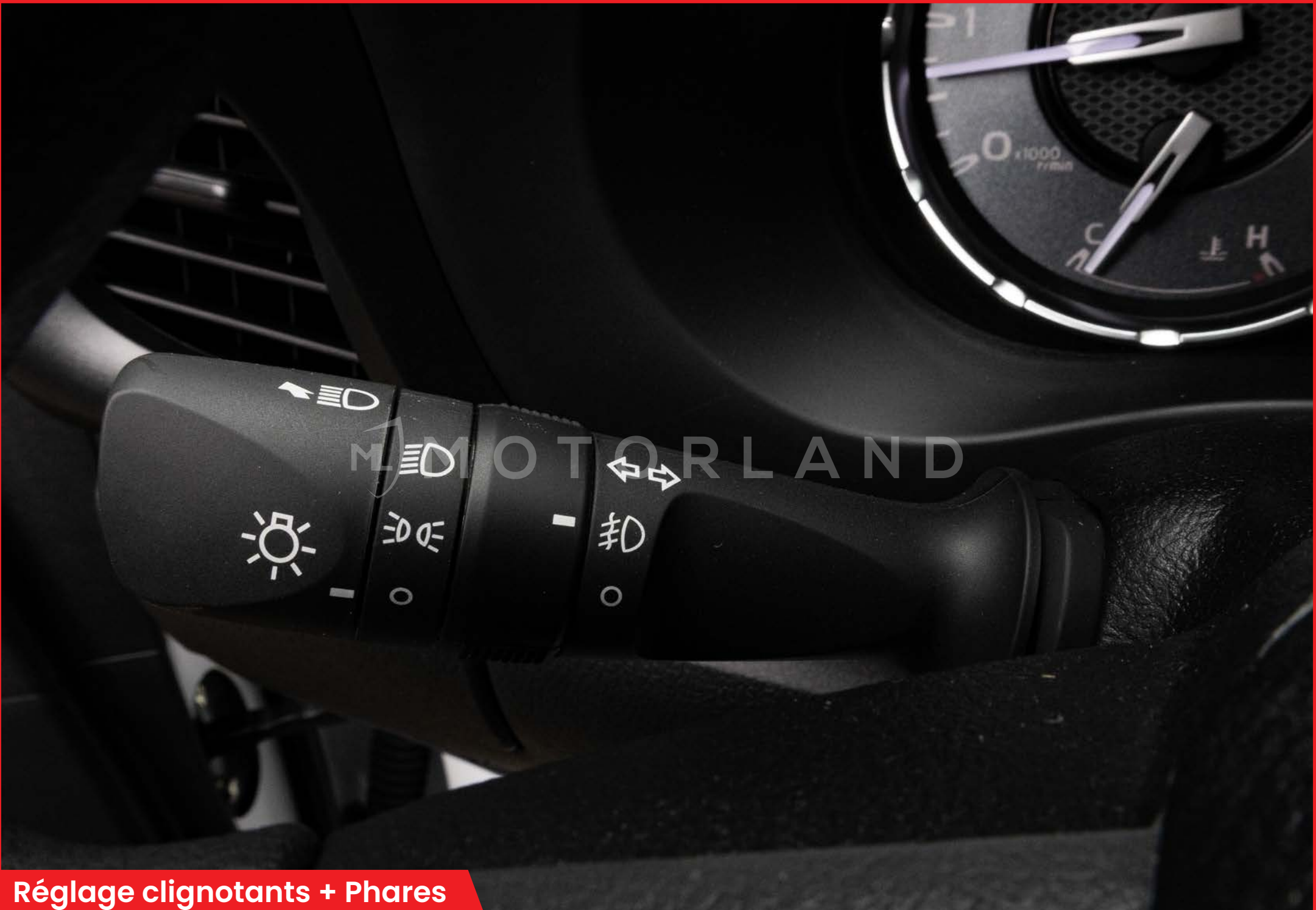
Réglage clignotants + Phares