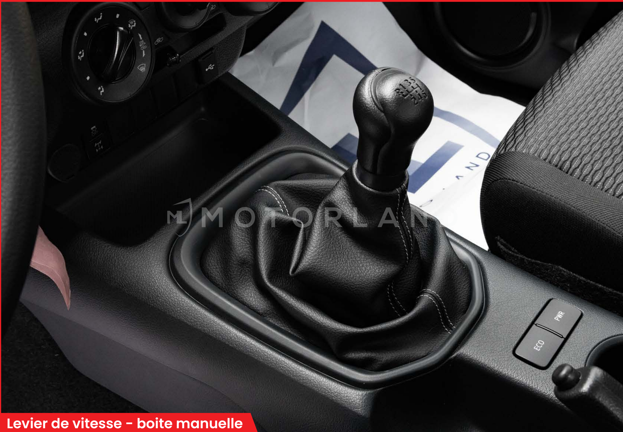
Levier de vitesse – boîte manuelle