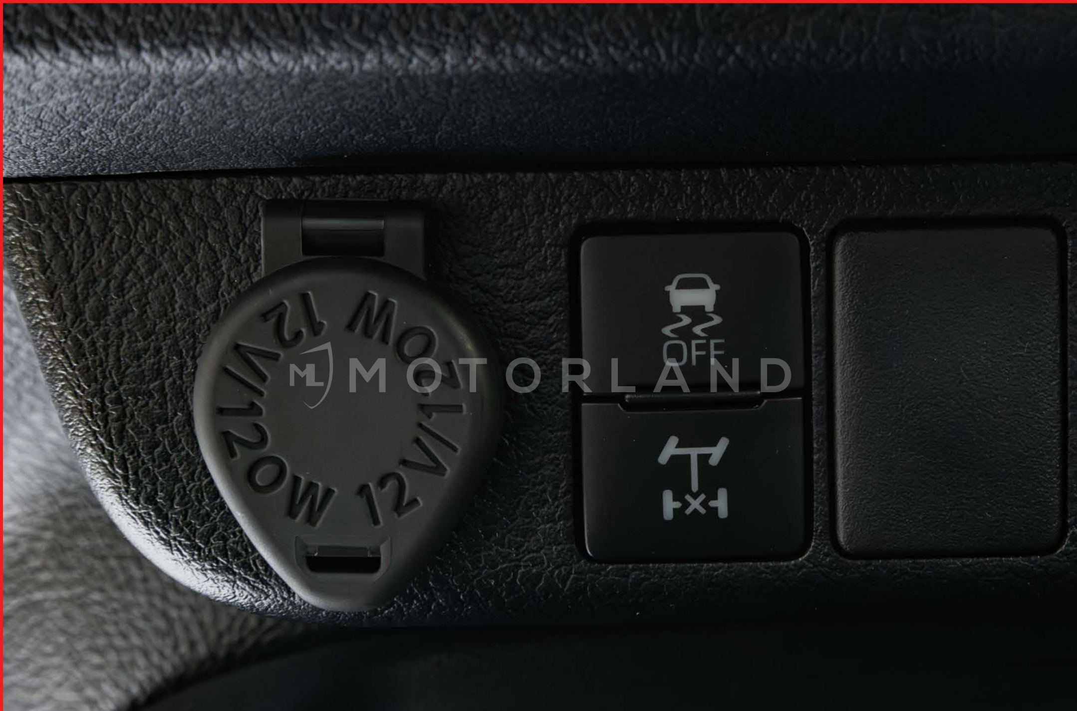
Prise 12V + Assistance de conduite