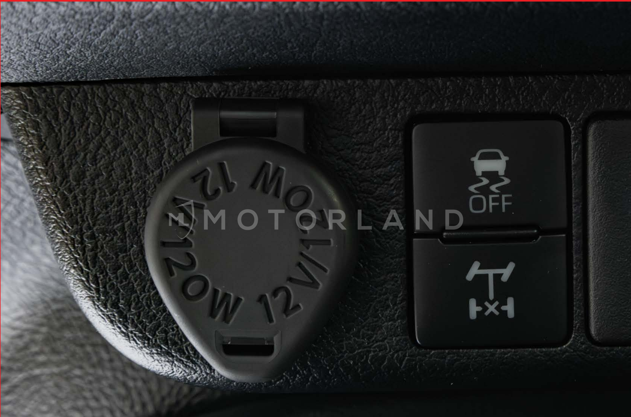
Prise 12V + Contrôle de Stabilité