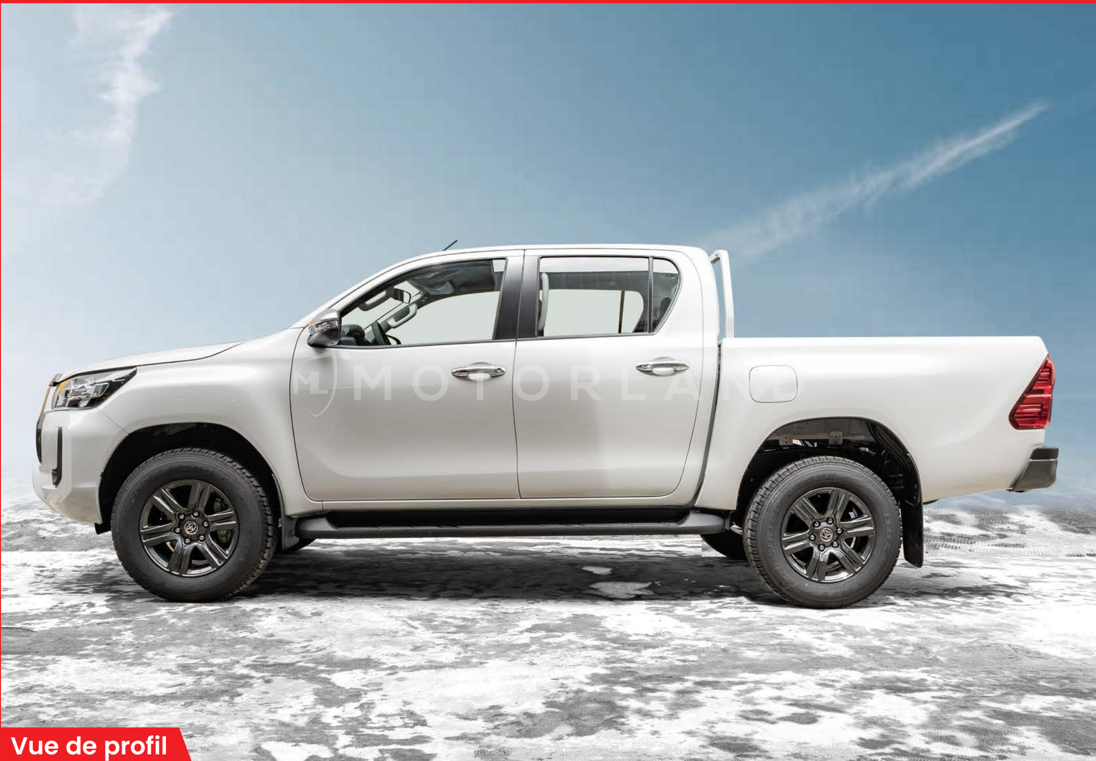
Vue de profil