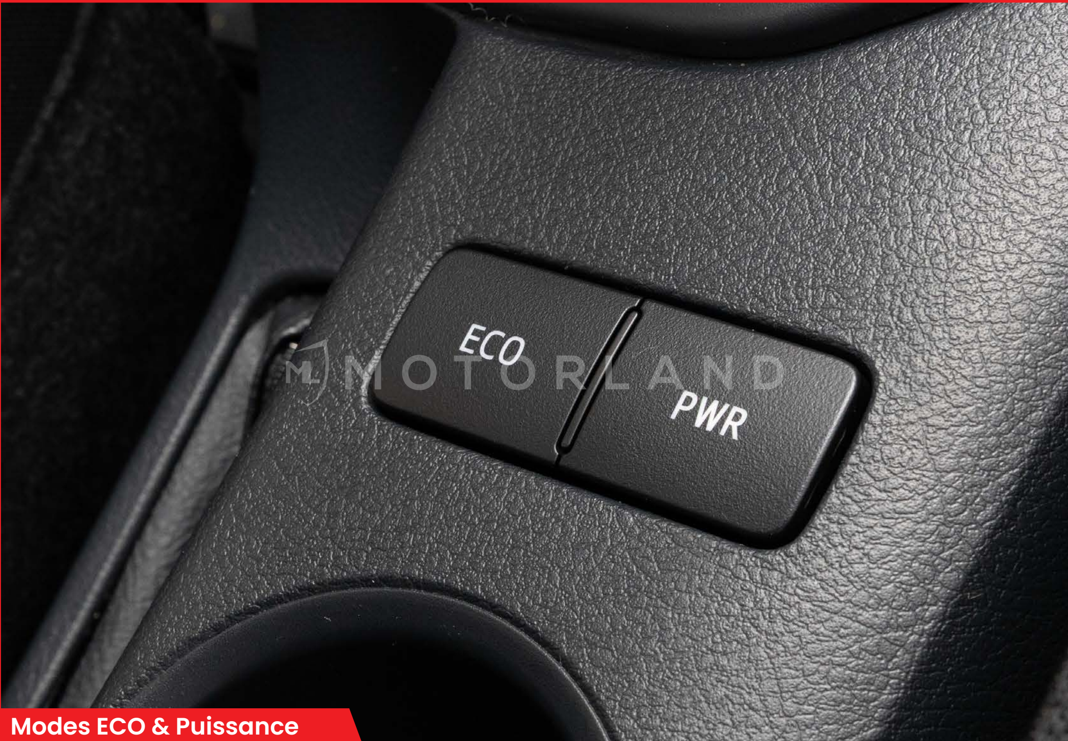
Modes ECO & Puissance