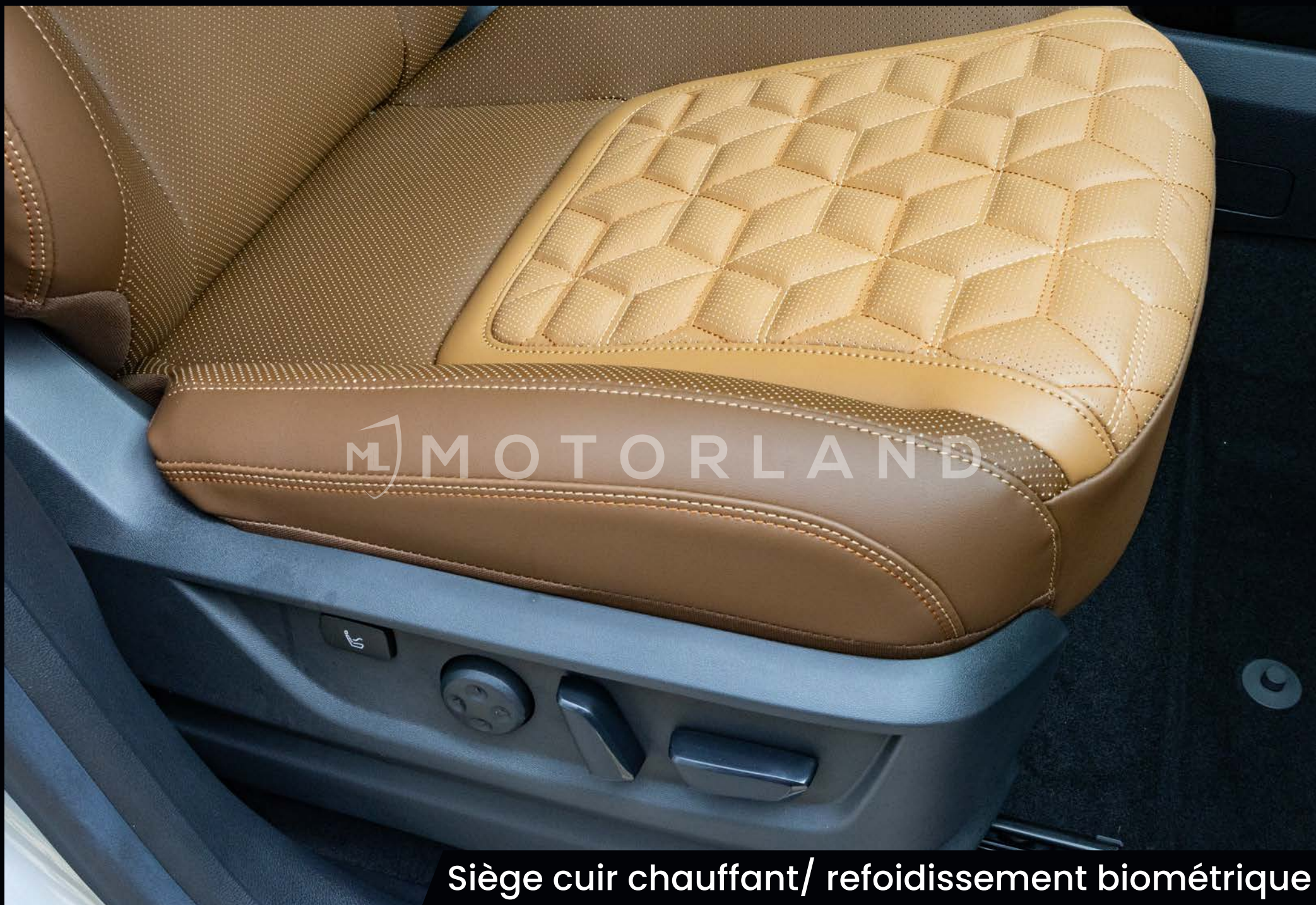
Siège cuir chauffant/ refoidissement biométrique