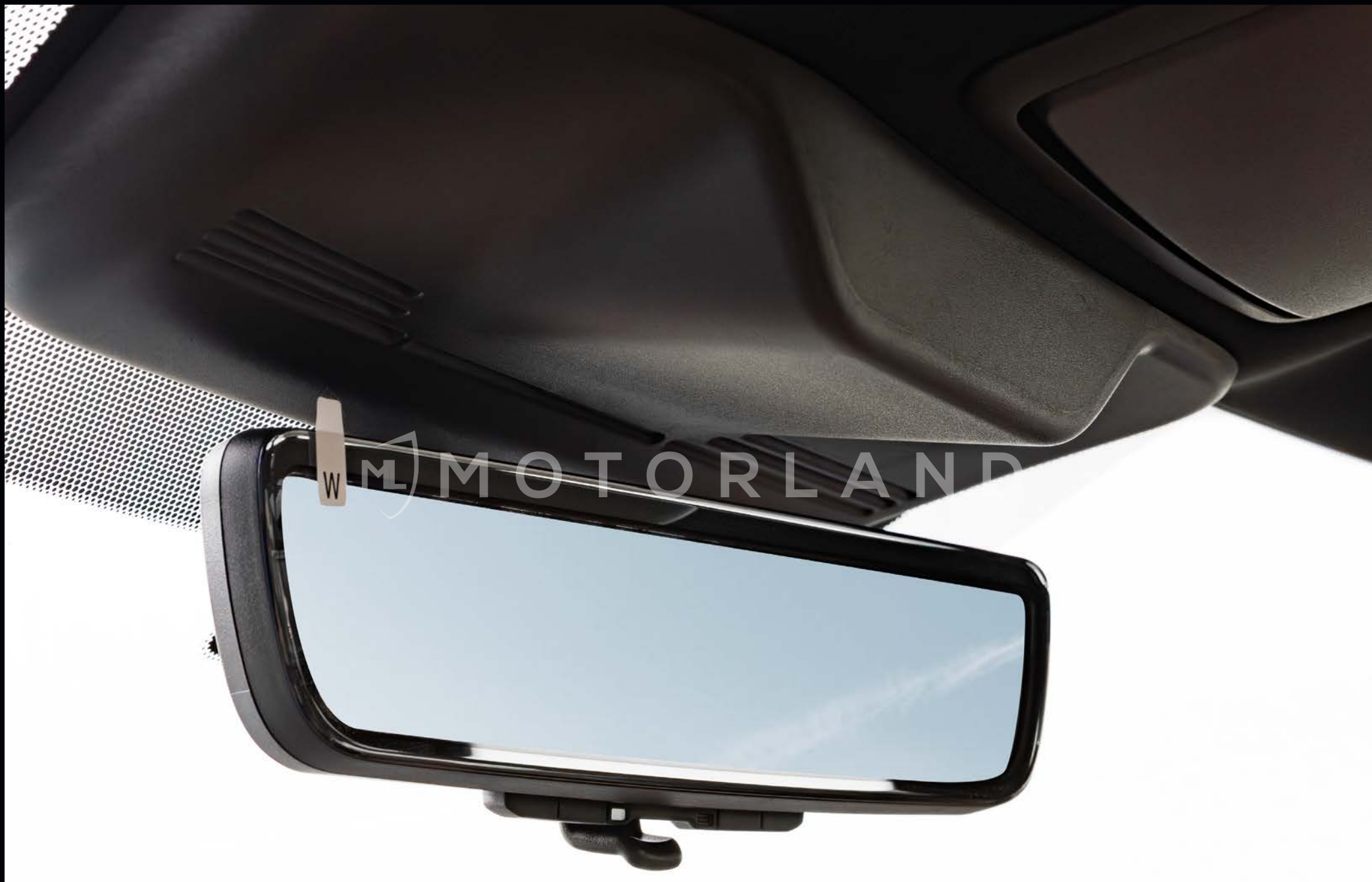
Rétroviseur interne électrique avec écran LED