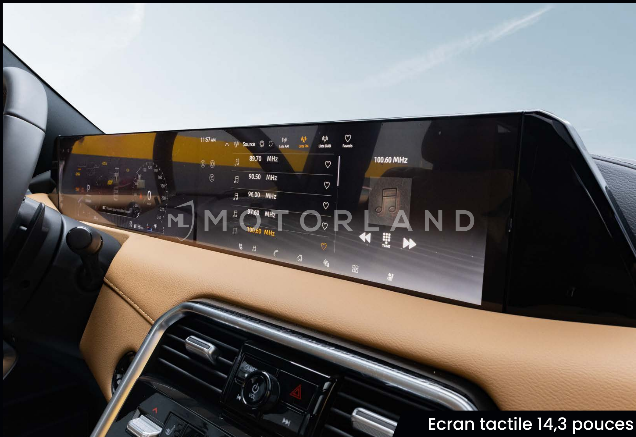
Ecran tactile 14,3 pouces