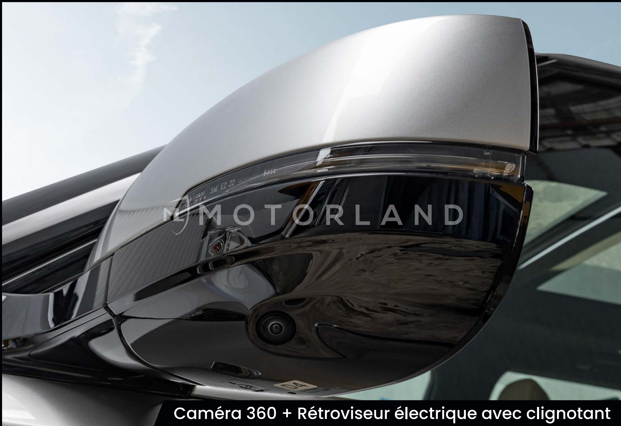
Caméra 360 + Rétroviseur électrique avec clignotant