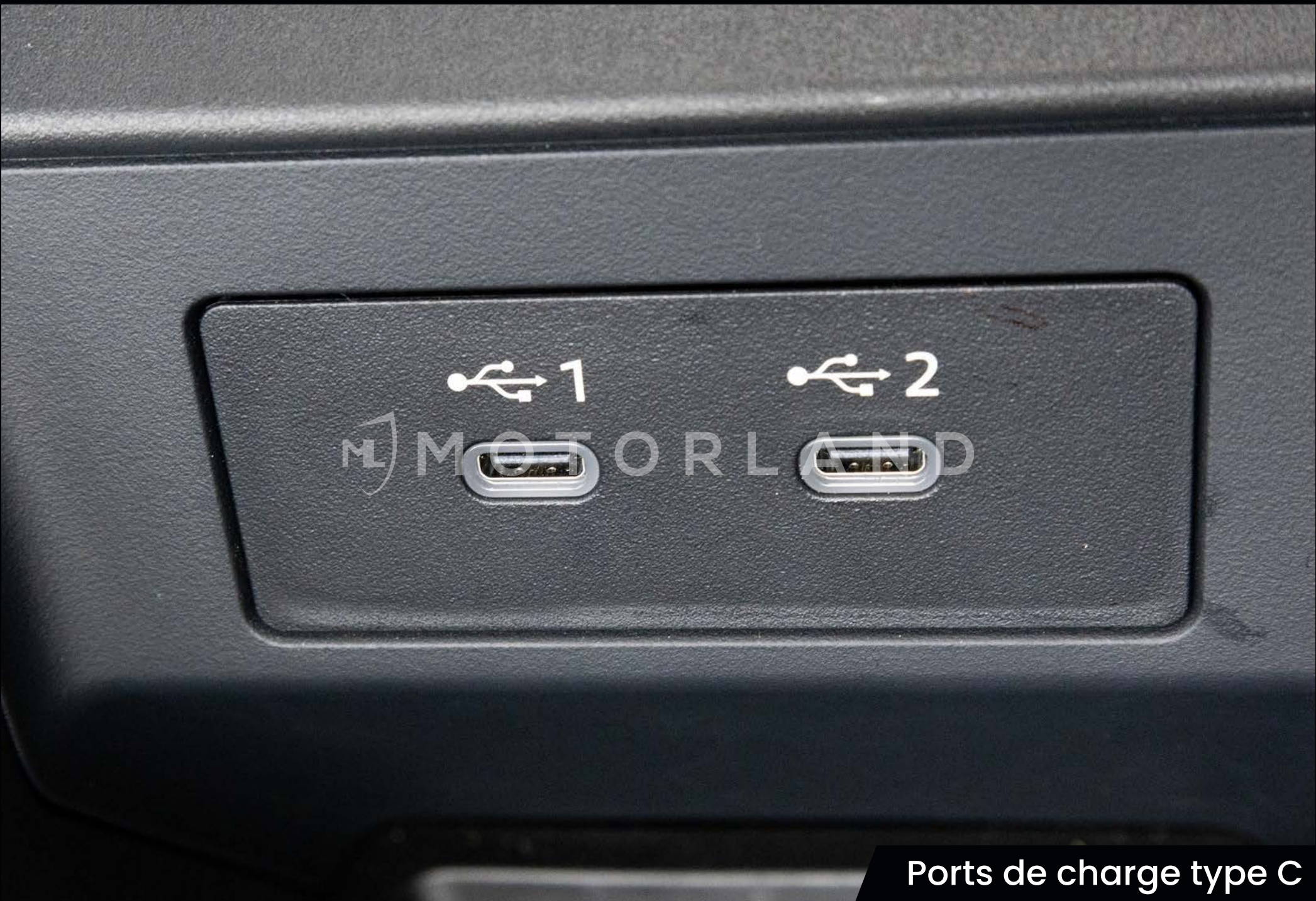
Ports de charge type C