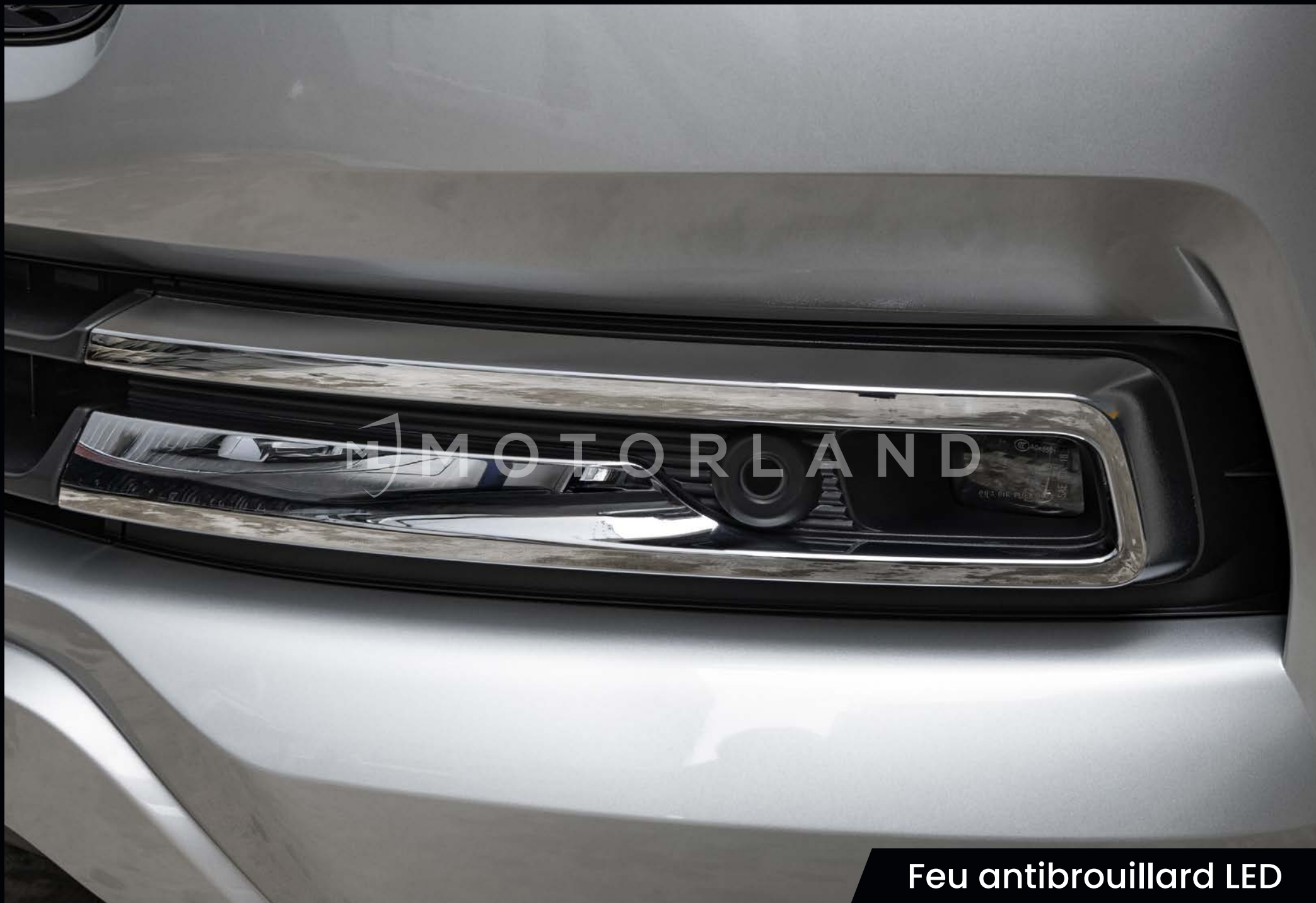
Feu antibrouillard LED