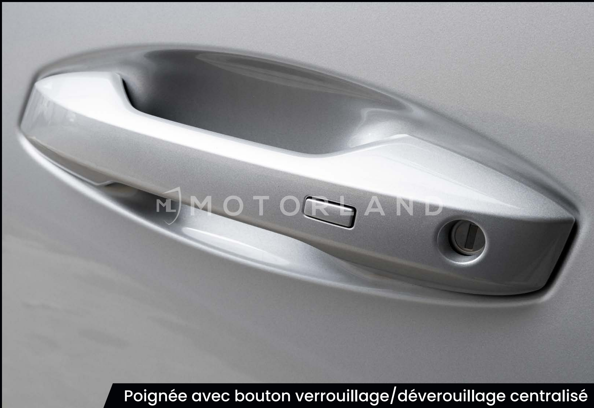
Poignée avec bouton verrouillage/déverrouillage centralisé