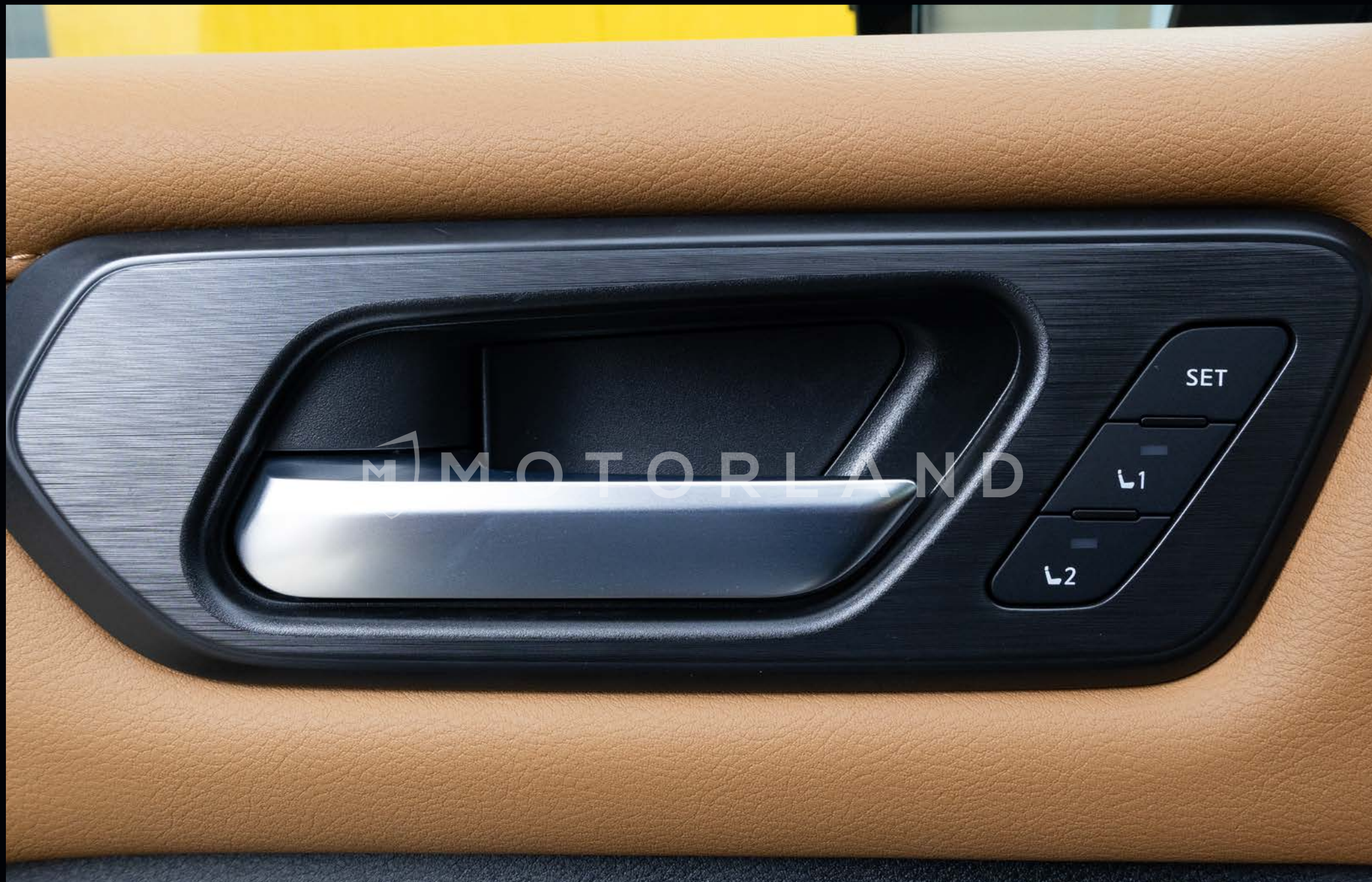
Panneau de commande de la mémoire de position du siège