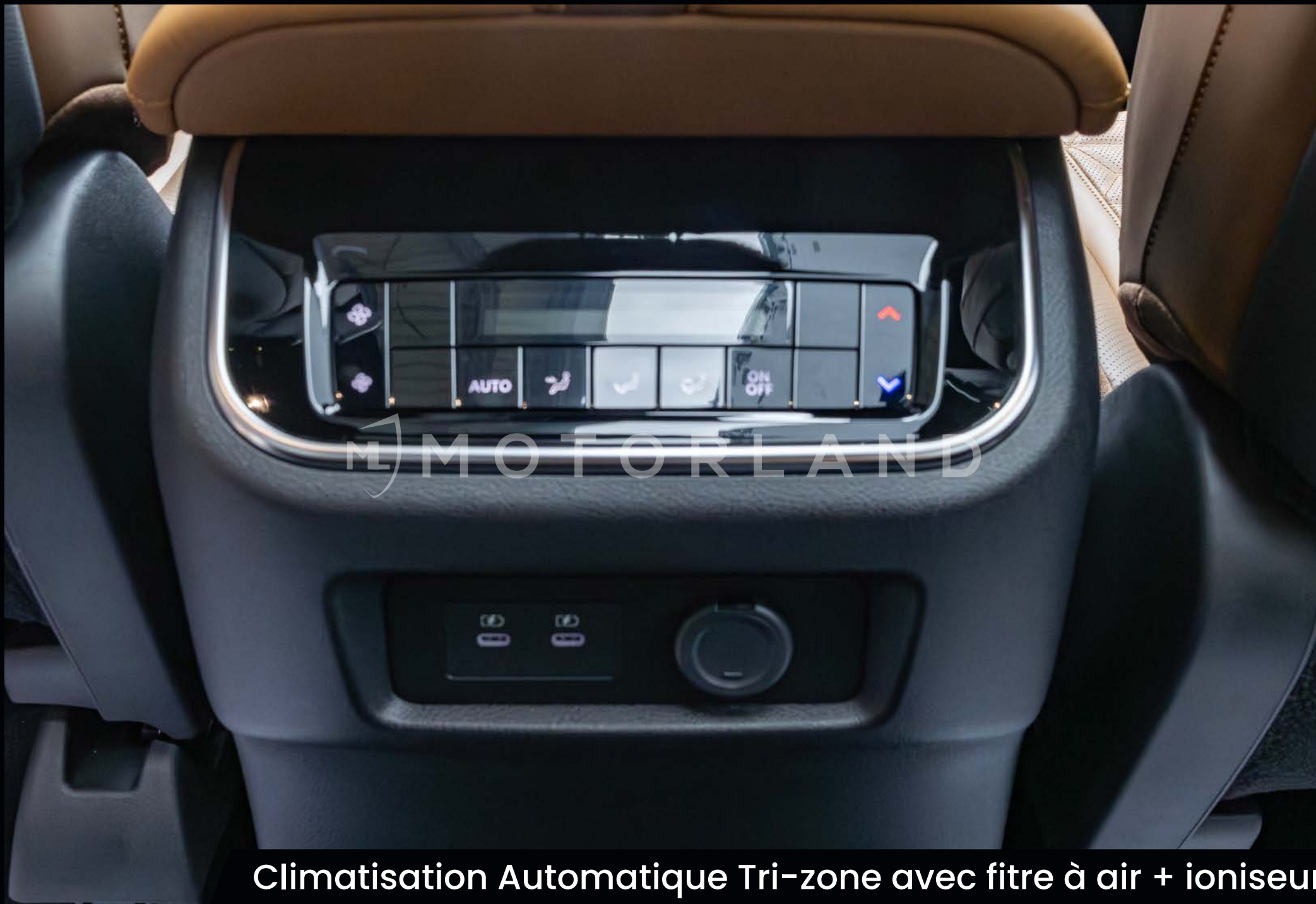
Climatisation Automatique Tri-zone avec filtre à air + ioniseur