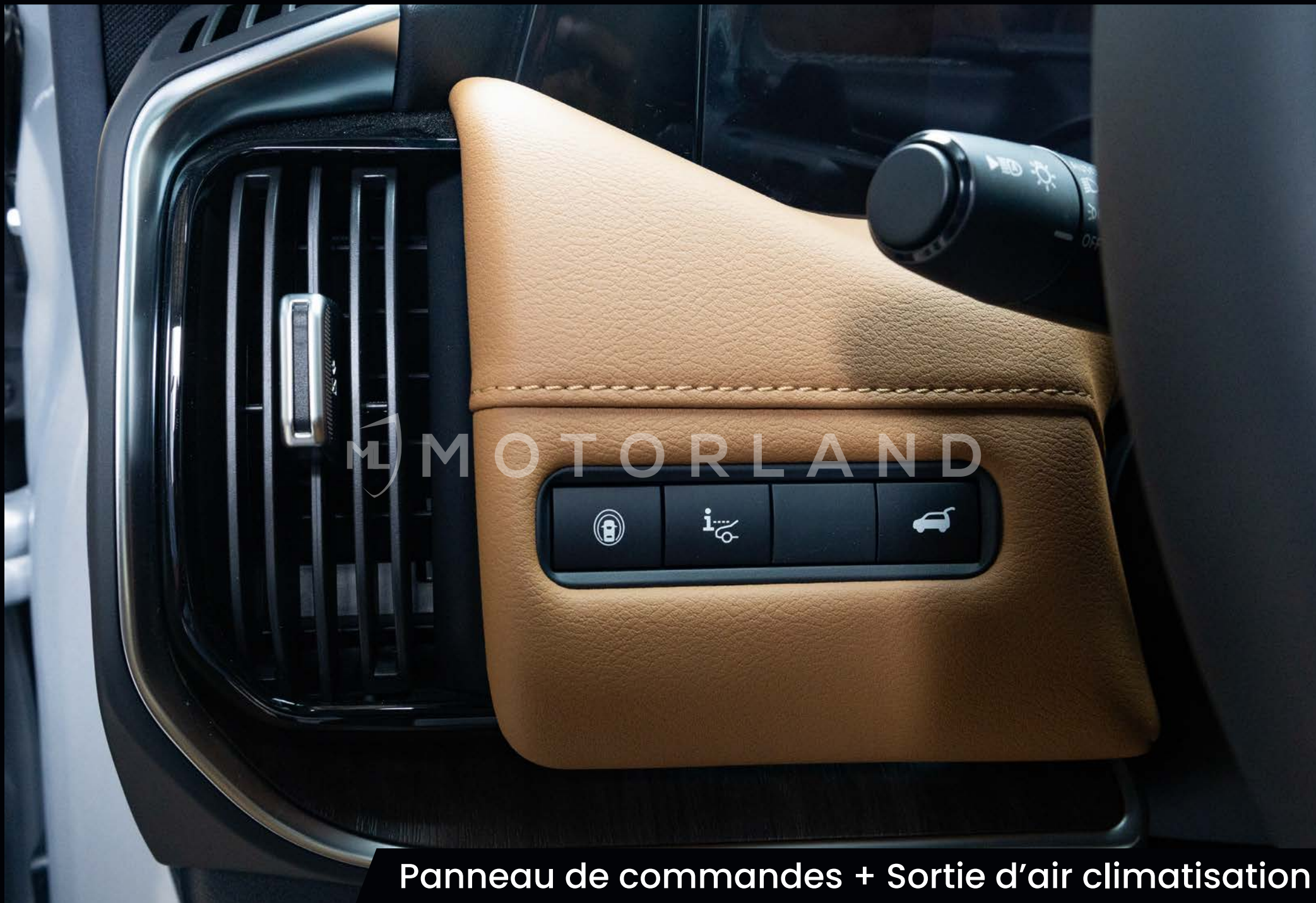
Panneau de commandes + Sortie d'air climatisation