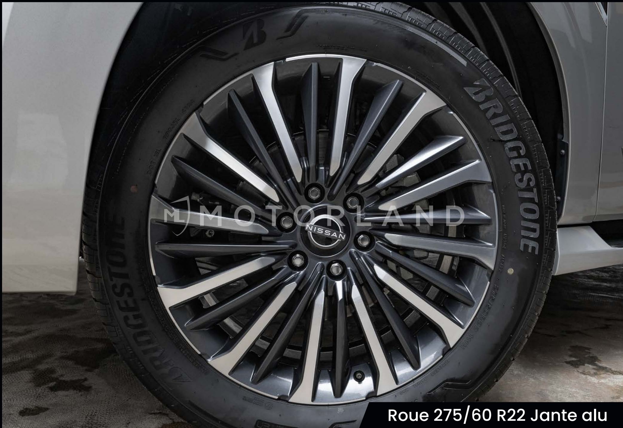
Roue 275/60 R22 Jante alu