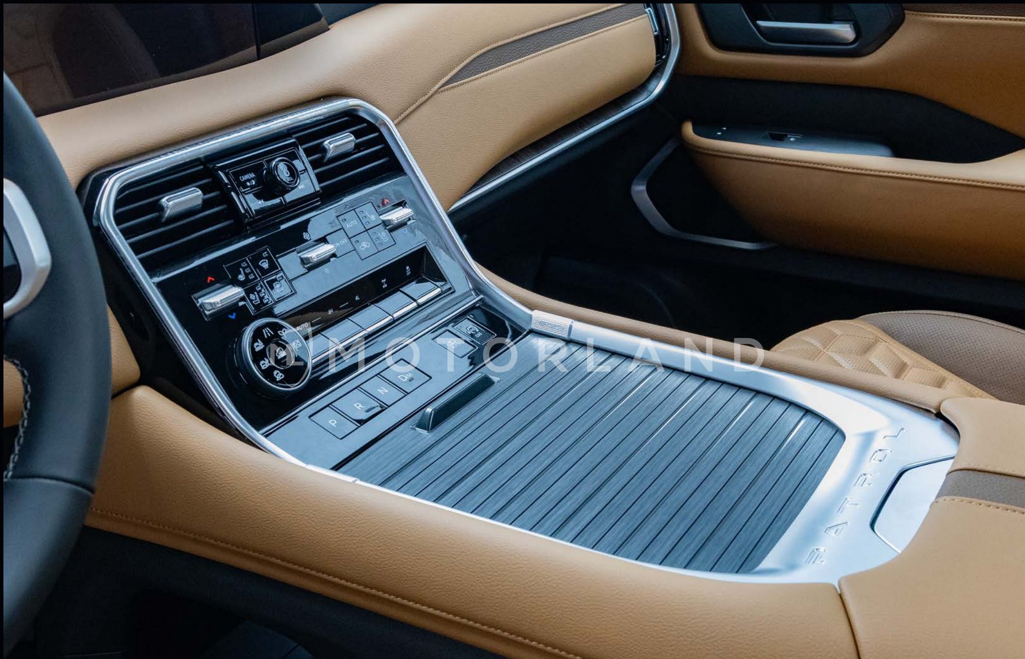
Systeme de climatisation + Boite vitesse automatique