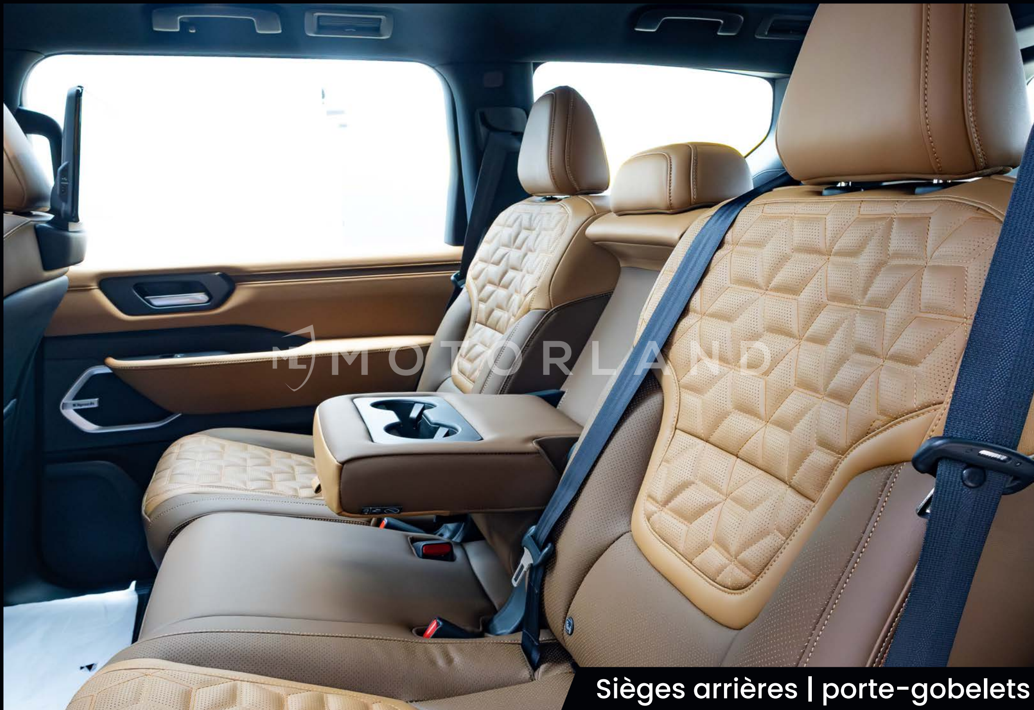
Sièges arrières | porte-gobelets