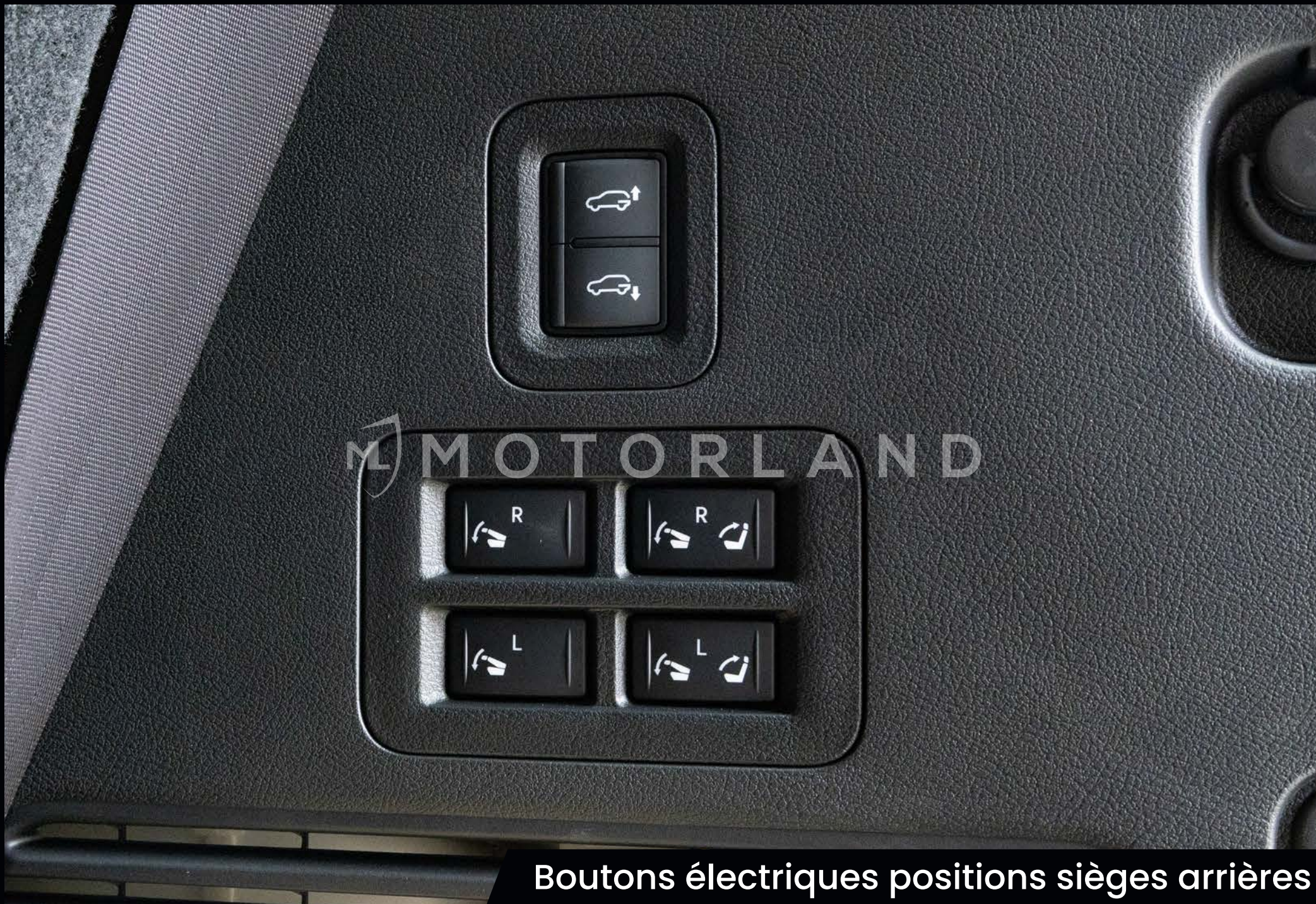
Boutons électriques positions sièges arrières