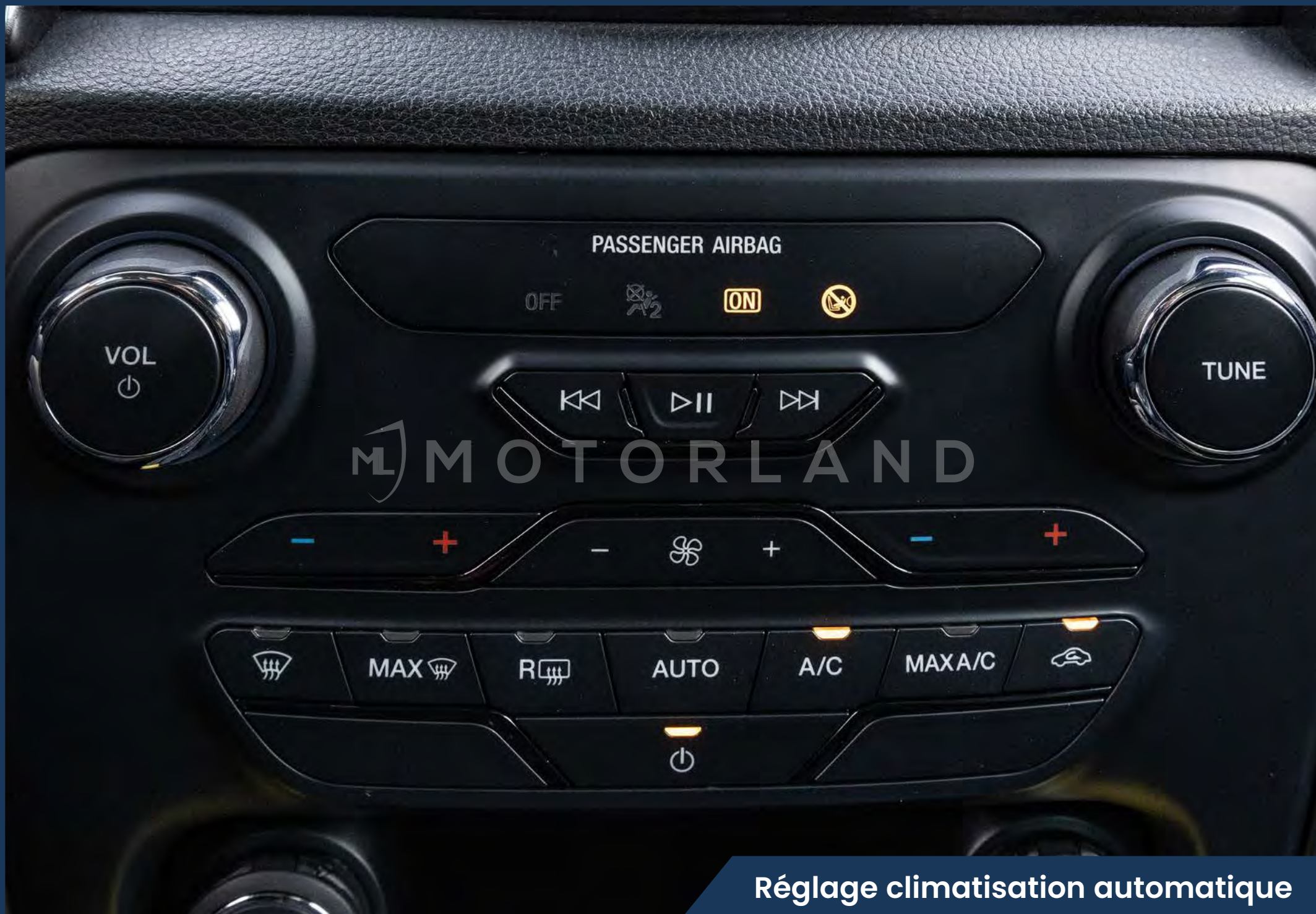
Réglage climatisation automatique