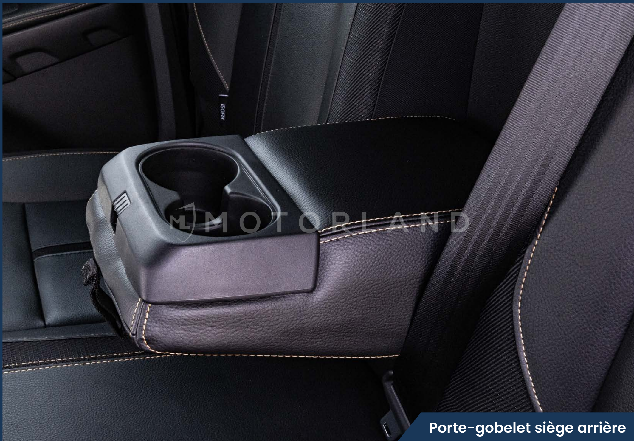
Porte-gobelet siège arrière