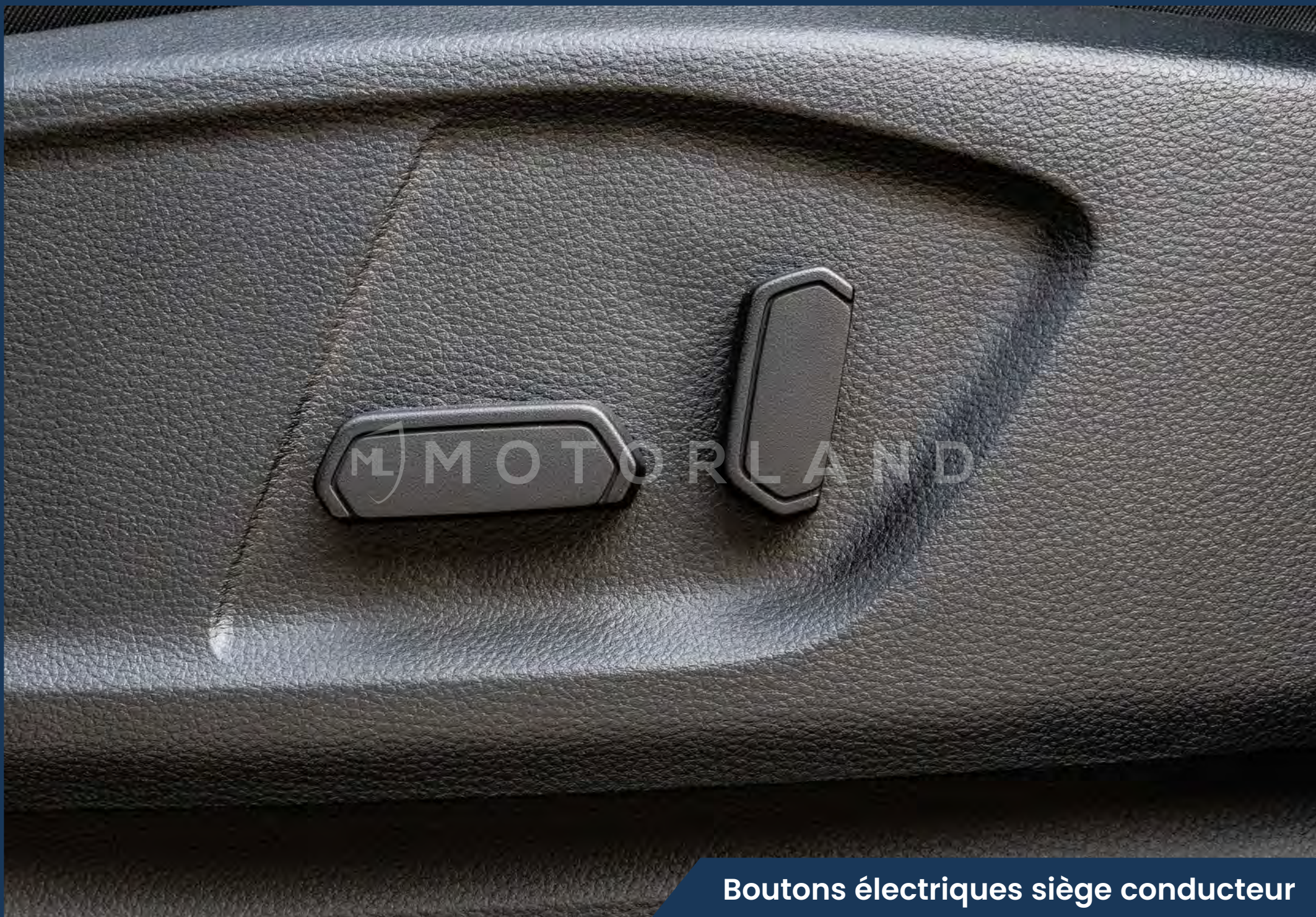
Boutons électriques siège conducteur