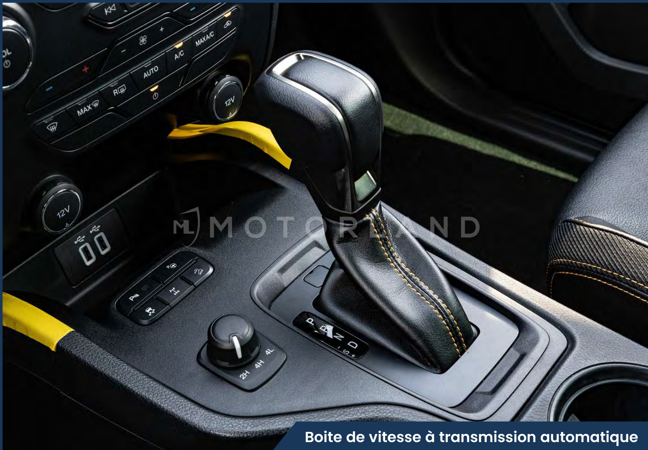
Boite de vitesse à transmission automatique