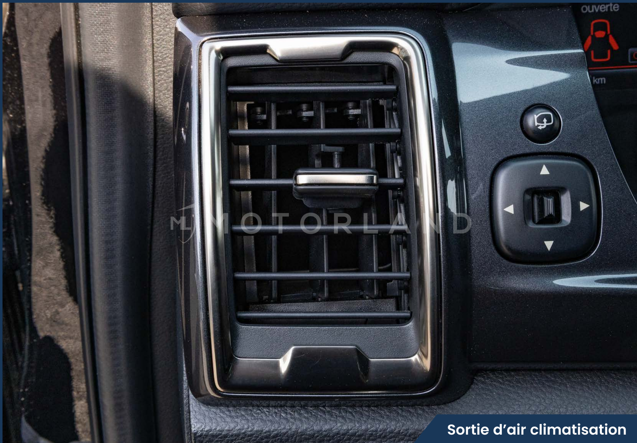
Sortie d'air climatisation