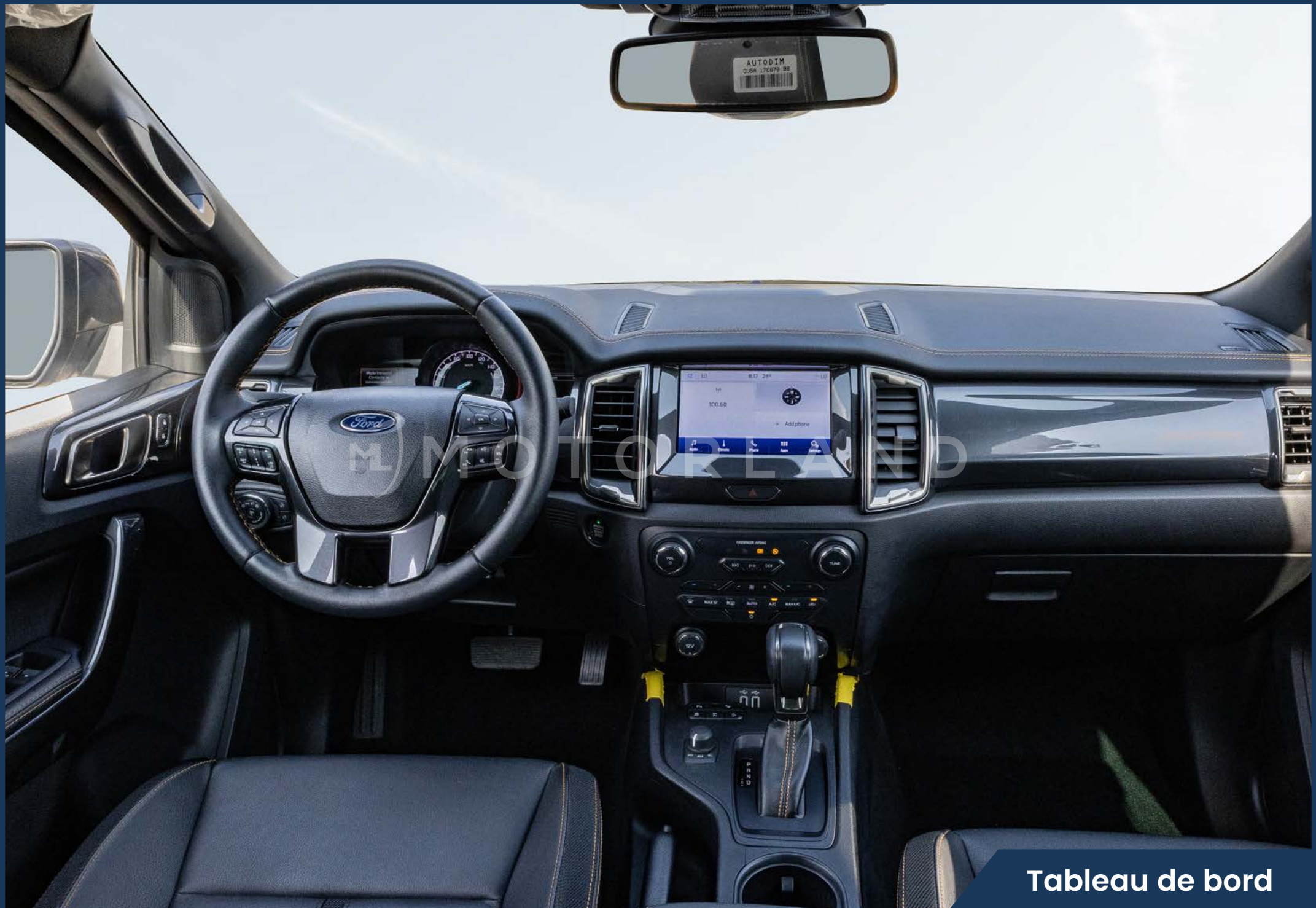
Tableau de bord