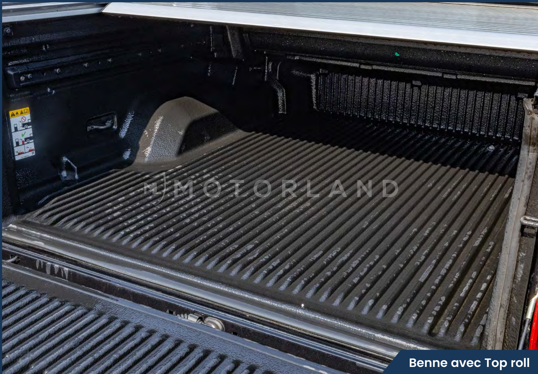
Benne avec Top roll