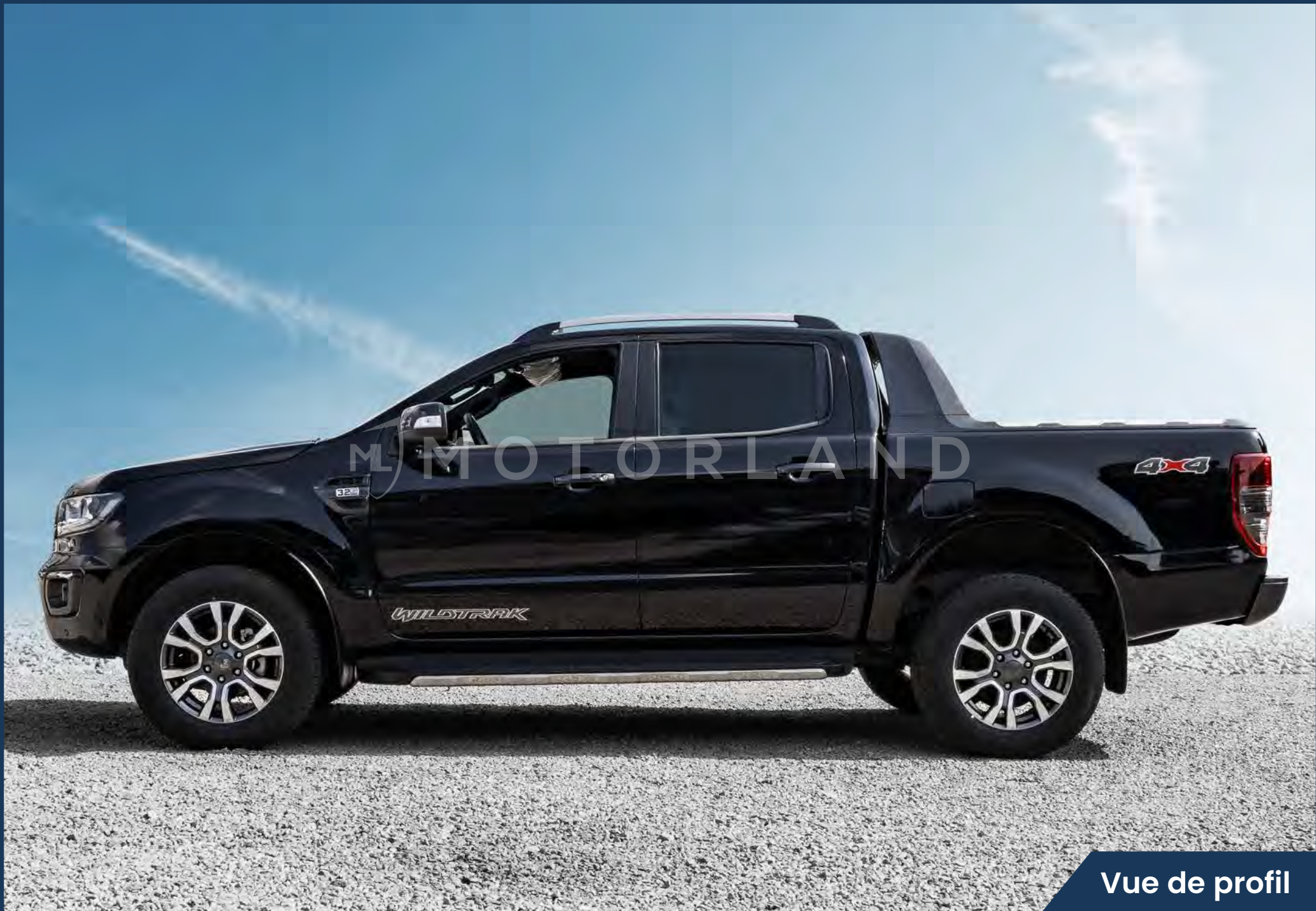
Vue de profil