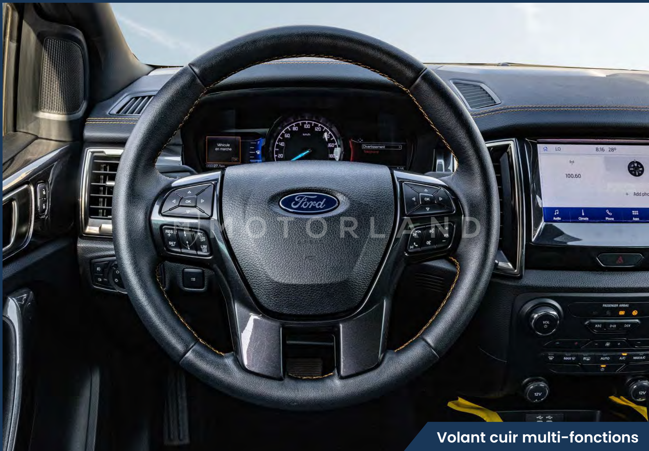
Volant cuir multi-fonctions