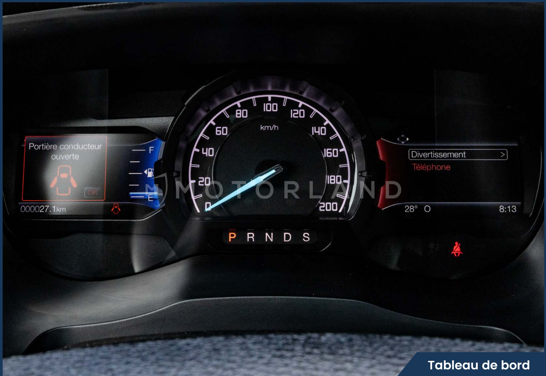
Tableau de bord