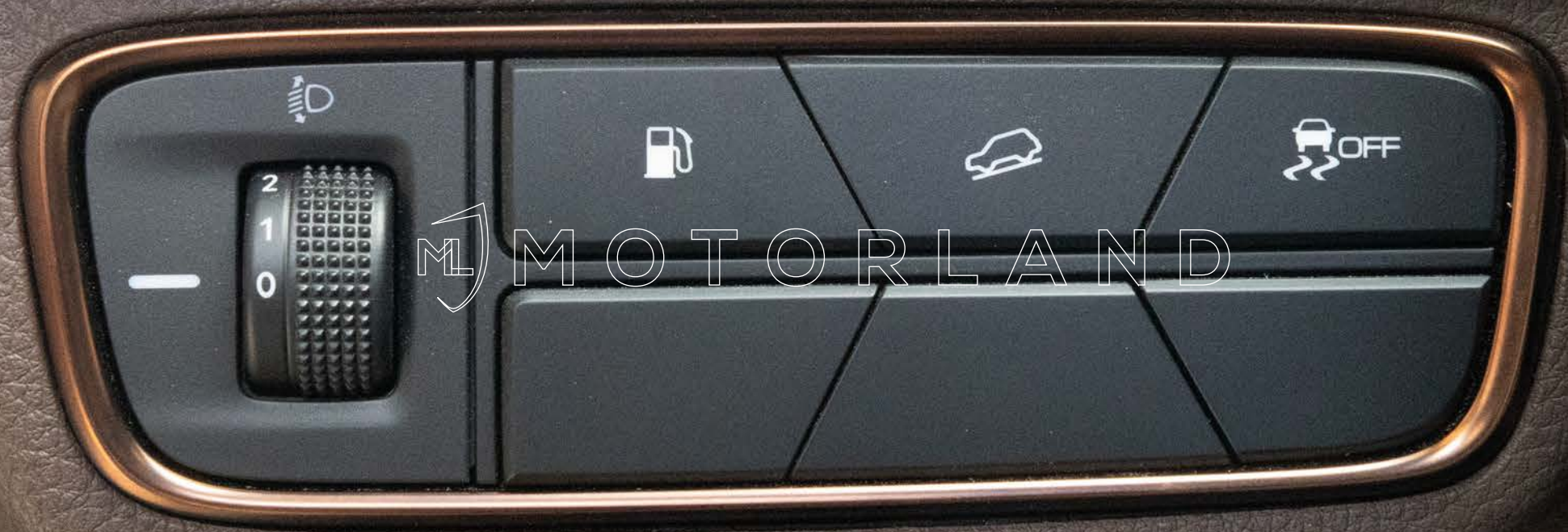
Panneau de commandes (phares - stabilité - assistance pente)