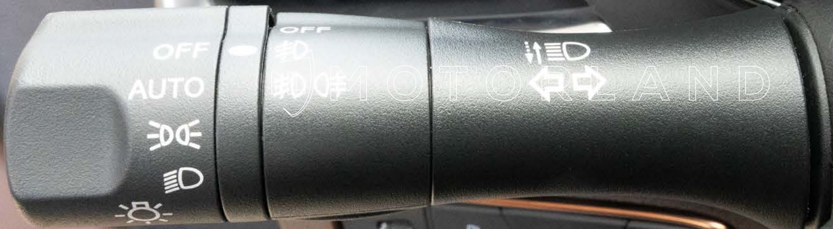
Réglage phare + clignotant