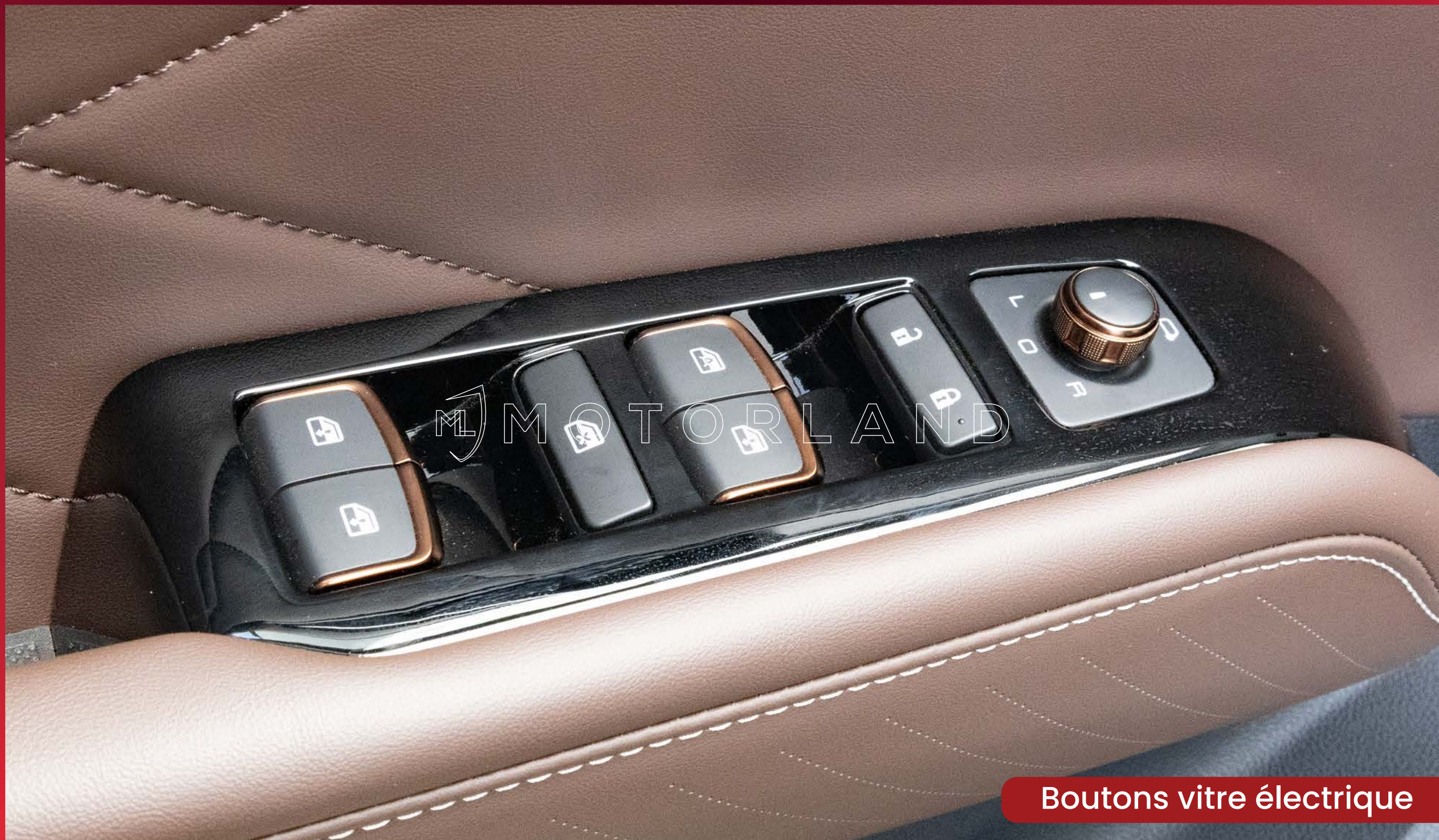
Boutons vitre électrique